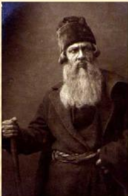
Иван Сусанин (бас) – характер важный.