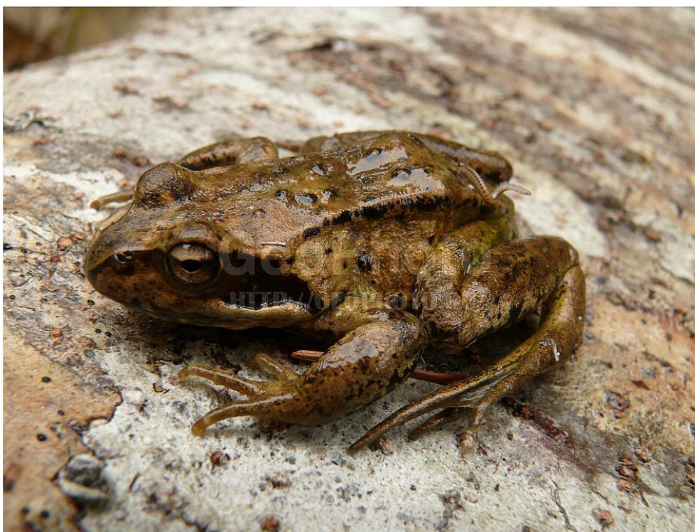
# nat21120811 Collection <Animals of the South Kuril Islands> Natalin Andrey (C) GeoPhoto.Ru