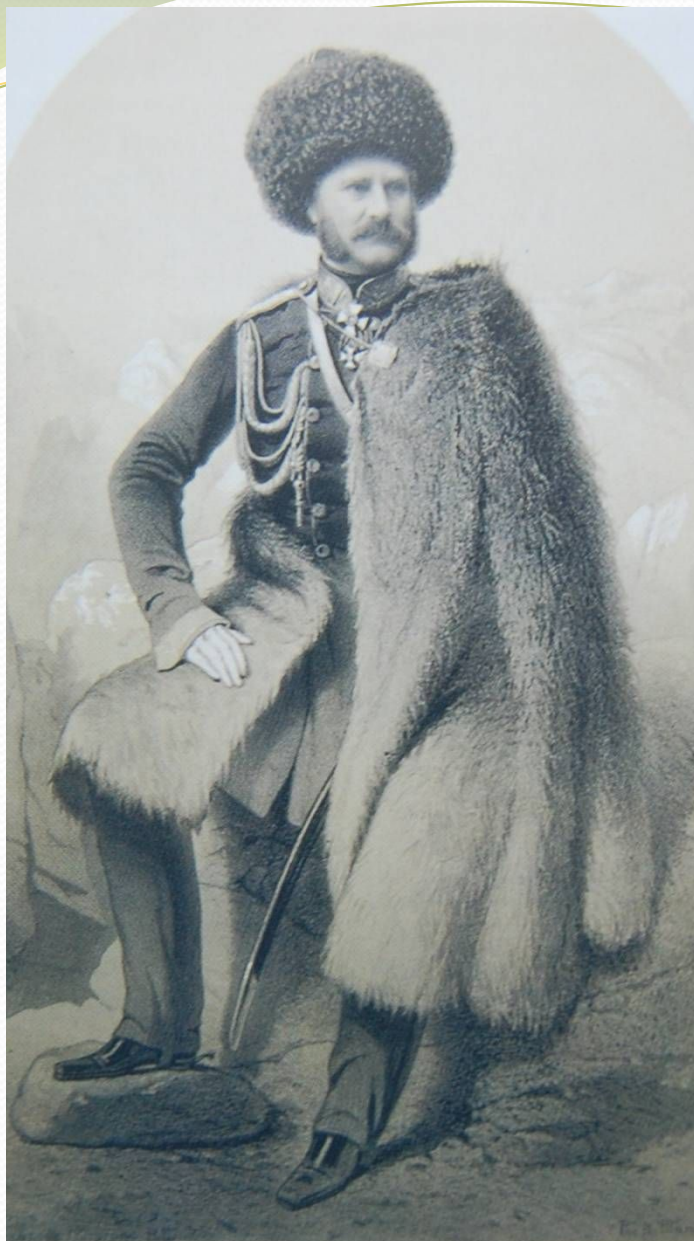
Александр Иванович Барятинский