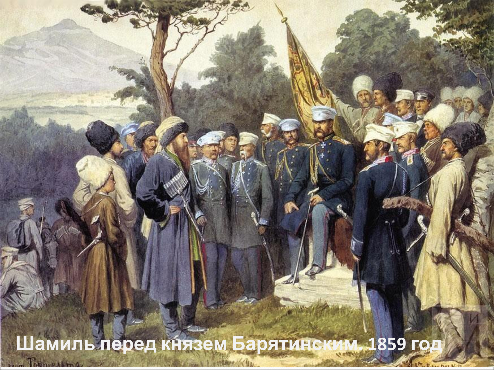
Шамиль перед князем Барятинским. 1859 год