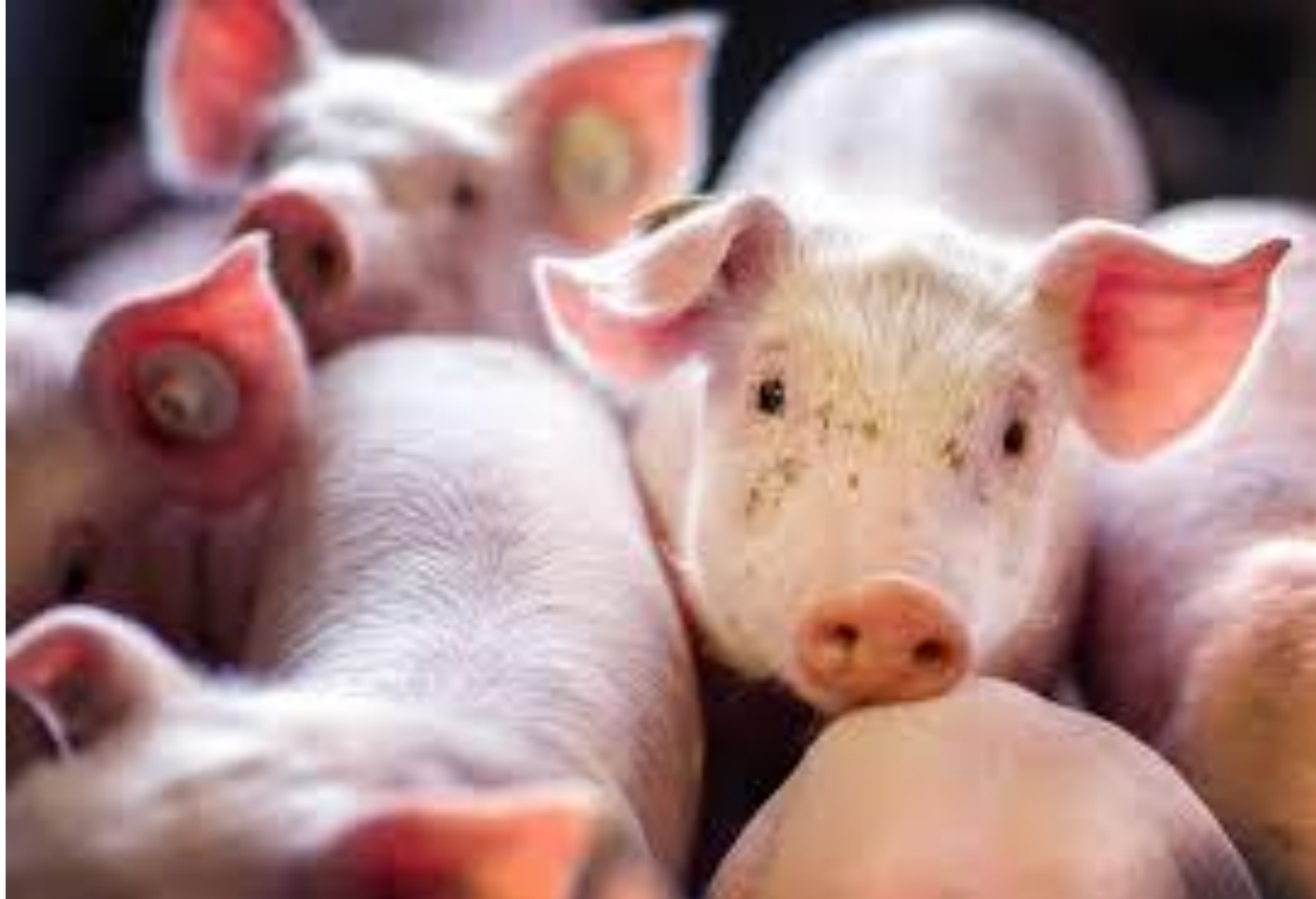
Grekow Ilya, Klasse 10A Schuljahr