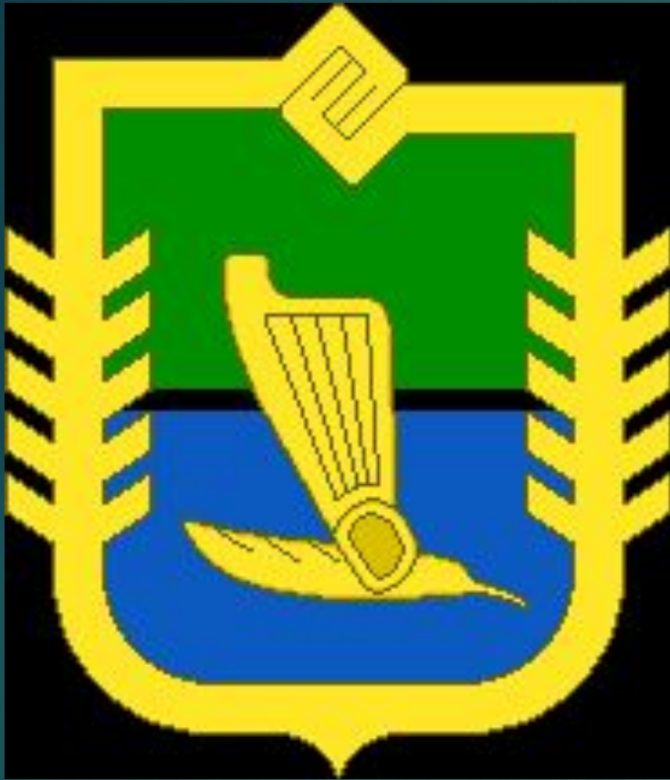
Герб Калевальского района