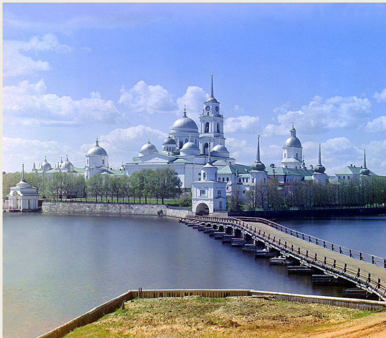
Нило-Столобенская пустынь на озере Селигер. 1910