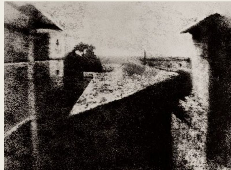
Гелиогравюра «Вид из окна в Ле Гра», отпечатанная с литографического клише

Отправной станцией, ведущей к изобретению первого фотоаппарата, стало наблюдение того, что растворенные соли железа на свету меняют цвет. С 1800 года создать фотоснимок пытались многие, но удалось это только через двенадцать лет Ж.Н.Непсу – изобретателю фотоаппарата-обскуры, снабженного линзой и раздвигающейся трубкой. Именно он придумал работающий фотоаппарат, на котором сделали первую