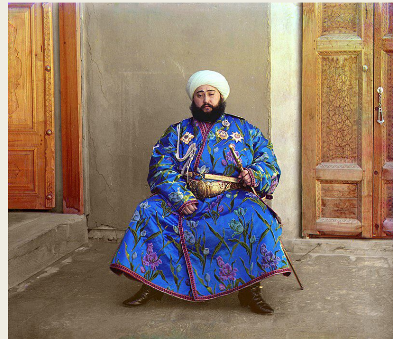
Сейид Алим-хан (1880—1944), эмир Бухары. 1907