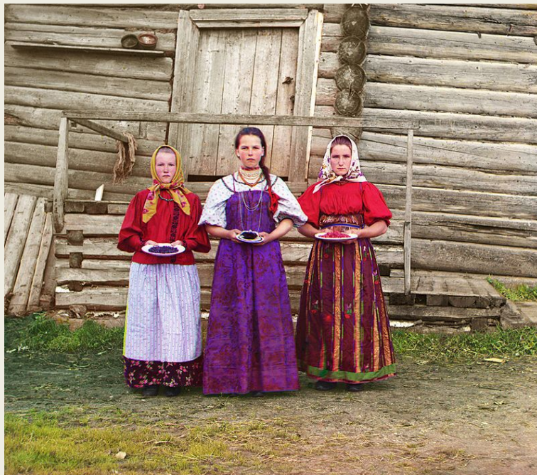
Молодые русские крестьянки недалеко от реки Шексна. 1909