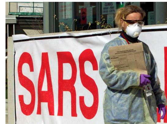
Атипичная пневмония SARS