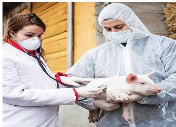
Свиной грипп H1N1