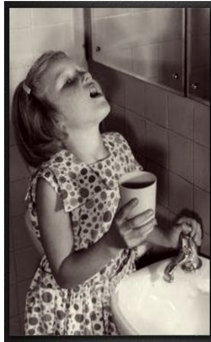
1957: “Азиатский грипп” 2 млн погибших