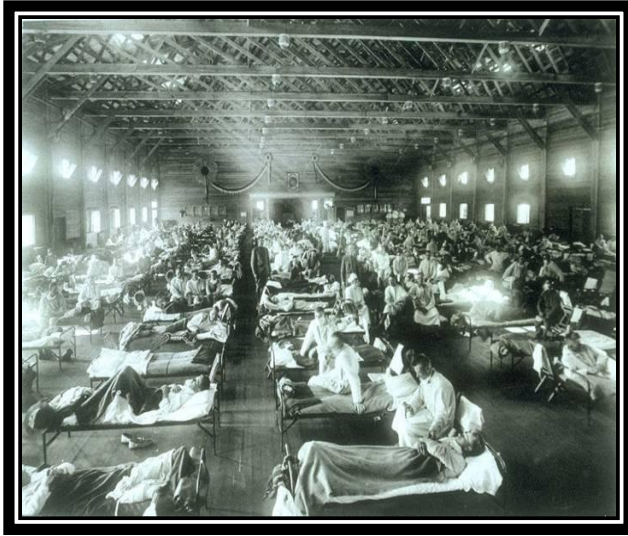
1918: “Испанка” 20 млн погибших