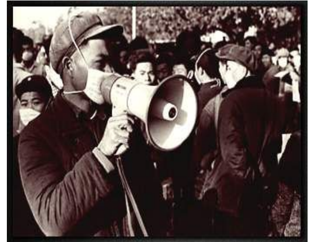
1968: “Гонконгский грипп” > 1 млн погибших