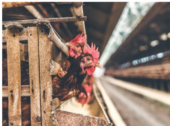
Птичий грипп H5N1