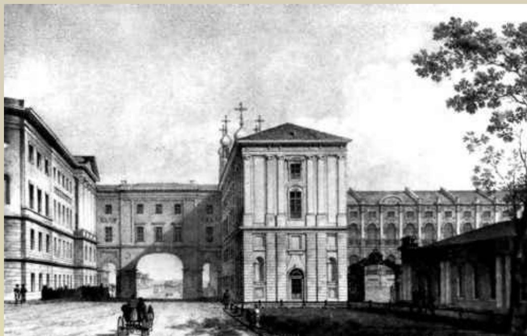
А.А.Тон Царское Село. Лицей. 1822.