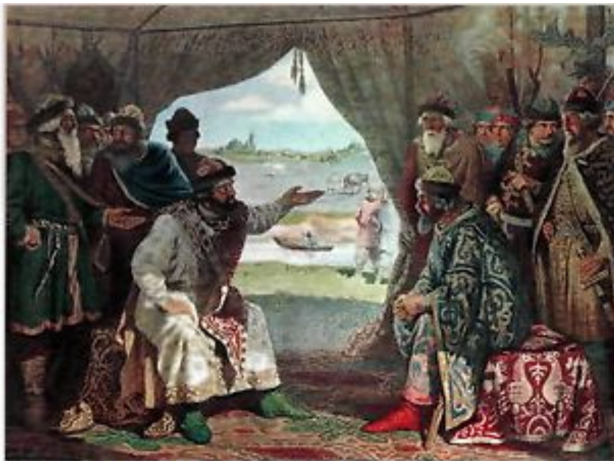
А.Д. Кившенко. «Долобский съезд князей - свидание князя Владимира Мономаха с князем Святополком».

Некому было противостоять врагу: русские князья никак не могли объединиться и перестать враждовать.