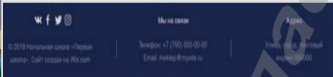
Рис. 26. Нижний раздел

3. Footer – нижний раздел – находится на всех страницах сайта, содержит контактную информацию, значки аккаунтов социальных сетей, дополняется информацией об авторских правах (рис. 26).