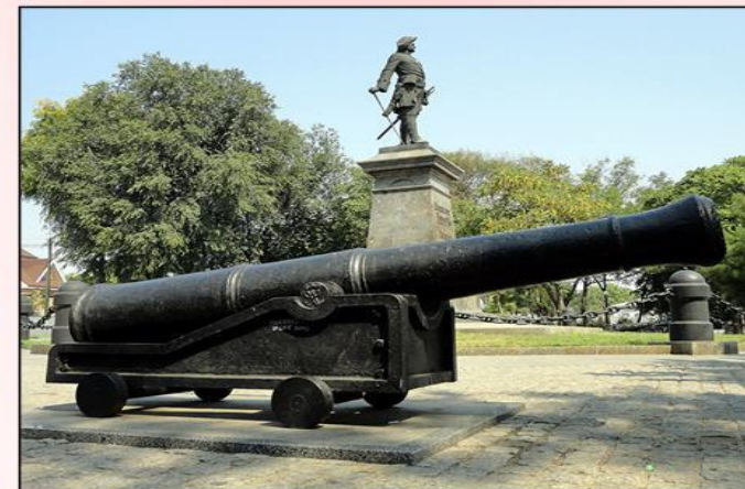
Памятник Петру I в Таганроге