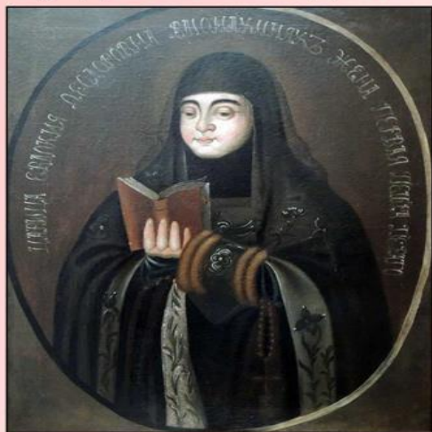
Первая жена Петра I Евдокия Лопухина в монашеском облачении

Расторгнув брак с женой, в 1703 г. Пётр I увлекся 19-летней Катериной (в девичестве Марта Самуиловна Скавронская). Между ними завязался бурный роман, который продолжался долгие годы.