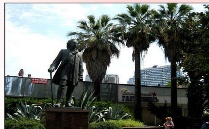
Памятник Петру I в Сочи