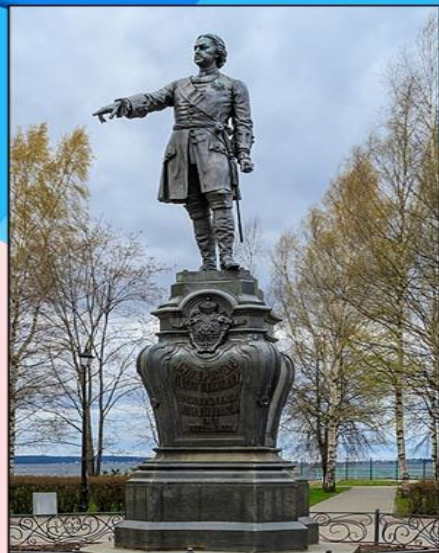
Памятник Петру I в Петрозаводске