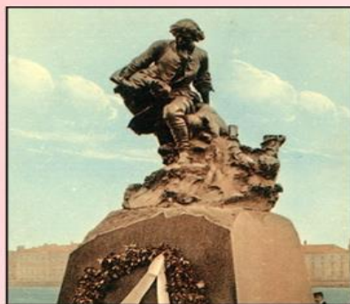
Памятник «Петр I спасает утопающих в Лахте в 1724 году».