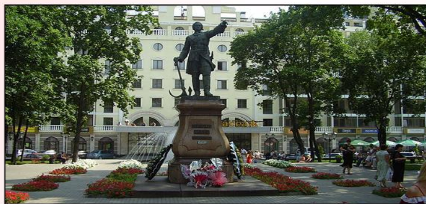
Памятник Петру I в Воронеже