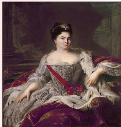
Вторая жена Петра I Екатерины I

Официально они поженились только в 1712 г., однако ещё до замужества она родила от императора дочерей Анну (1708) и Елизавету (1709). Елизавета позже стала императрицей (правила в 1741-1761)