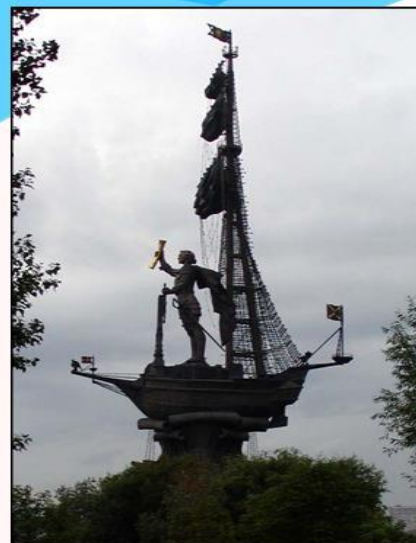
Памятник Петру I в Москве