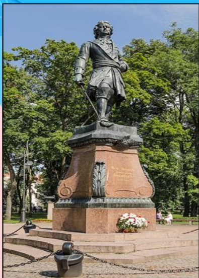
Памятник Петру I в Кронштадте

Память о Петре Великом увековечена во многих городах России и Европы.