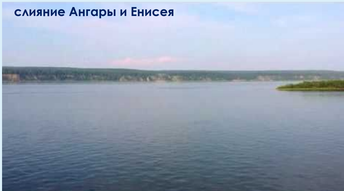
слияние Ангары и Енисея

Рядом с Лесосибирском в Красноярском крае Ангара впадает в Енисей. В месте слияния Ангара в 2 раза шире Енисея, далее несущего воды в Северный Ледовитый океан. Исторически сложилось, что мощный водный поток стал именоваться именно Енисеем. После воссоединения потоков двух великих рек слева течет мутная вода, а справа – прозрачная. Смешиваются воды после Лесосибирска, и далее граница между ними начинает размываться. Дальше воды Енисея единым мощным потоком несутся в более северные края.