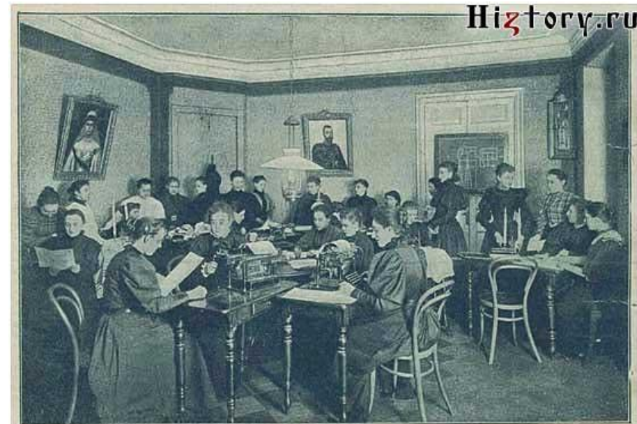
Домъ трудолюбія для образованныхъ женщинъ въ С.-Петербургѣ. Съ фот. авторства „Низы“.