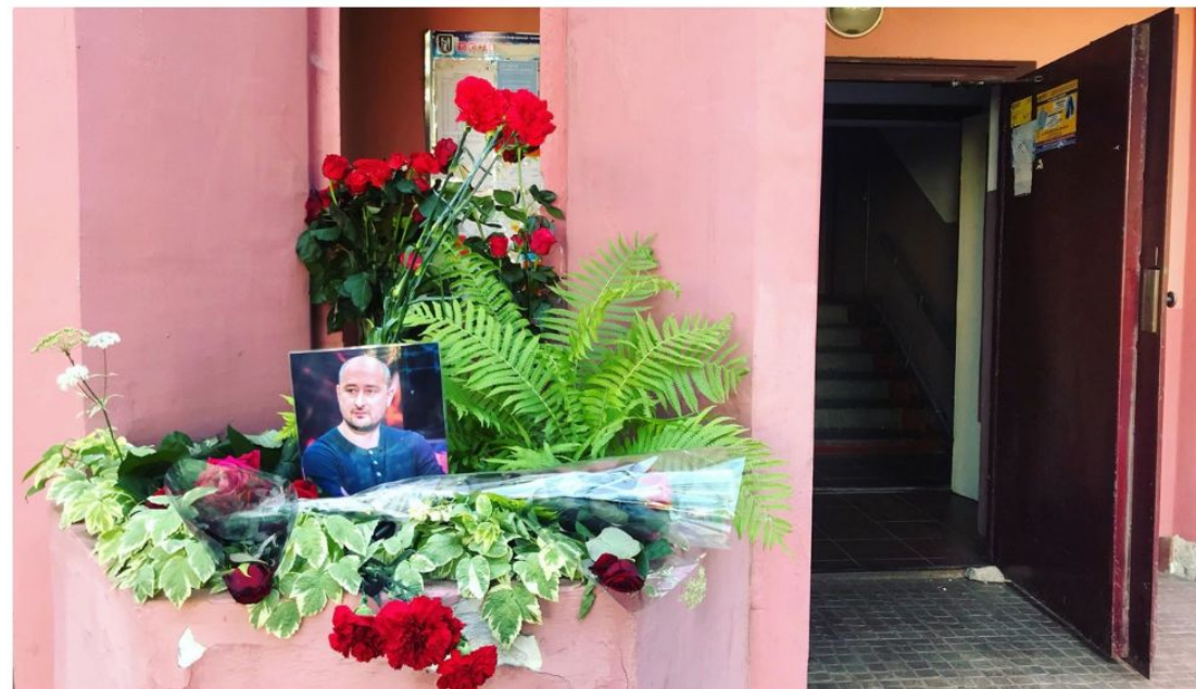
У подъезда дома Аркадия Бабченко в Киеве, 30 мая 2018 года