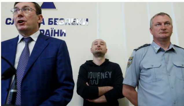
Генпрокурор Украины Юрий Луценко, журналист Аркадий Бабченко и глава полиции Украины Сергей Князев на пресс-конференции 30 мая