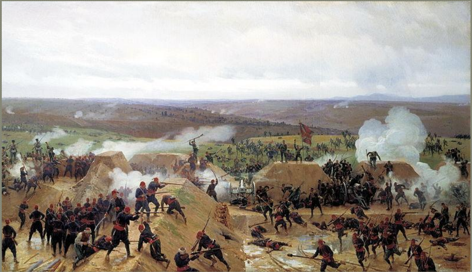
Захват Гривицкого редута под Плевной. Н. Дмитриев-Ориенбургский