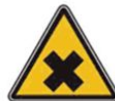
359 Осторожно. Вредные для здоровья аллергические (раздражающие) вещества