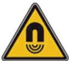
354 Внимание. Магнитное поле