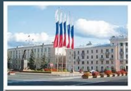
научно- исследовательские и проектные организации