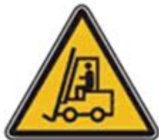
348 Внимание. Автопогрузчик