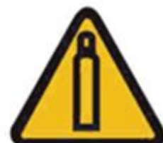
360 Опасно. Газовый баллон