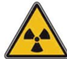
346 Опасно. Радиоактивные вещества или ионизирующее излучение