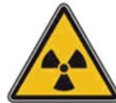
346 Опасно. Радиоактивные вещества или ионизирующее излучение