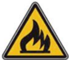
342 Опасно. Легковоспламеняющиеся вещества