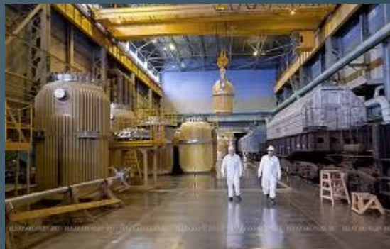
предприятия по переработке или изготовлению ядерного топлива