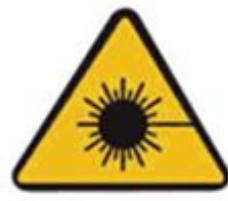
351 Опасно. Лазерное излучение