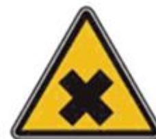
359 Осторожно. Вредные для здоровья аллергические (раздражающие) вещества