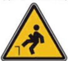
356 Осторожно. Возможность падения с высоты