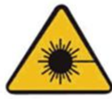
351 Опасно. Лазерное излучение