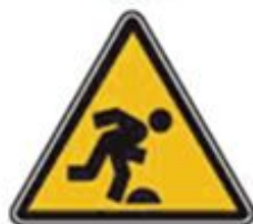
355 Осторожно. Малозаметное препятствие