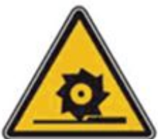
362 Осторожно. Режущие валы