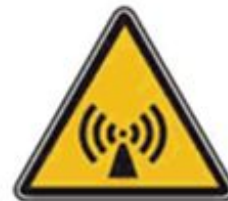
353 Внимание. Электромагнитное поле