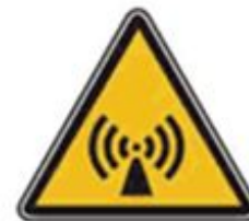
353 Внимание. Электромагнитное поле