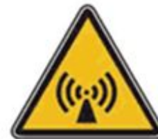
353 Внимание. Электромагнитное поле