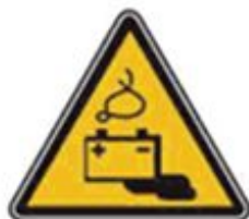
361 Осторожно. Аккумуляторные батареи