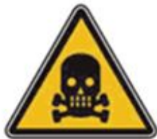
344 Опасно. Ядовитые вещества