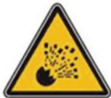
343 Опасно. Взрывоопасно