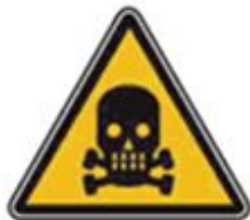
344 Опасно. Ядовитые вещества