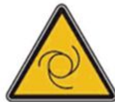
365 Внимание. Автоматическое включение (запуск) оборудования