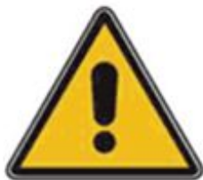
350 Внимание. Опасность (прочие опасности)