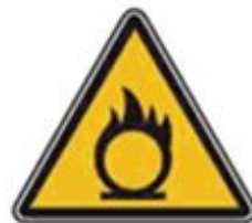
352 Опасно. Окислитель