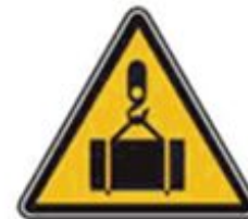
347 Опасно. Возможно падение груза