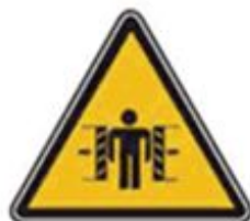
363 Внимание. Опасность зажима