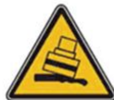
364 Осторожно. Возможность опрокидывания