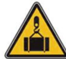
347 Опасно. Возможно падение груза