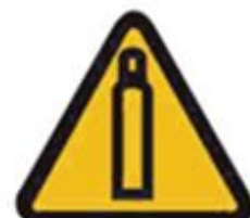
360 Газовый балон