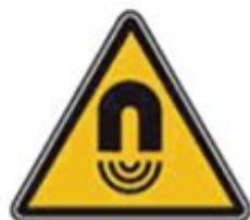
354 Внимание. Магнитное поле