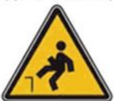
356 Осторожно. Возможность падения с высоты