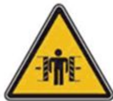
363 Внимание. Опасность зажима