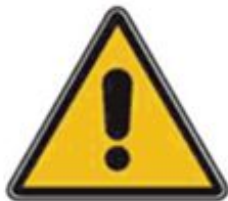
350 Внимание. Опасность (прочие опасности)