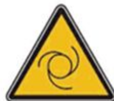
365 Внимание. Автоматическое включение (запуск) оборудования