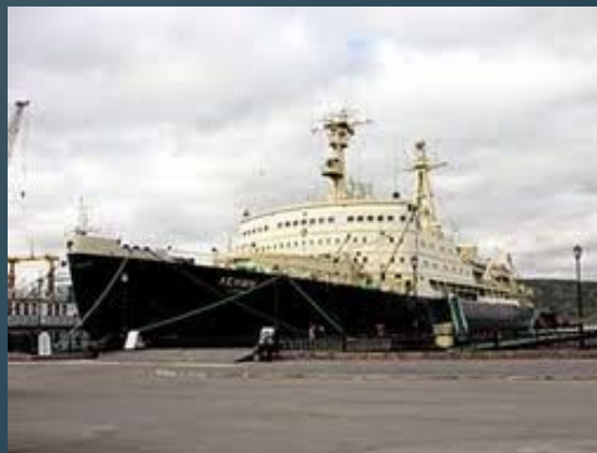
ядерные энергетические установки на транспорте.