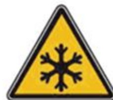
358 Осторожно. Холод