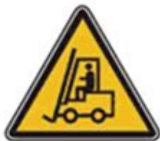
348 Внимание. Автопогрузчик