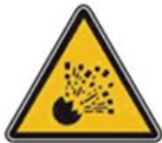
343 Опасно. Взрывоопасно