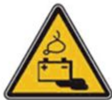
361 Осторожно. Аккумуляторные батареи