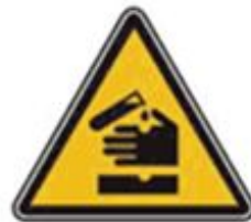
345 Опасно. Едкие и коррозионные вещества