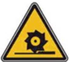
362 Осторожно. Режущие валы