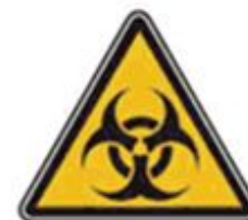
357 Осторожно. Биологическая опасность (Инфекционные вещества)