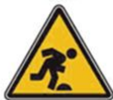
355 Осторожно. Малозаметное препятствие