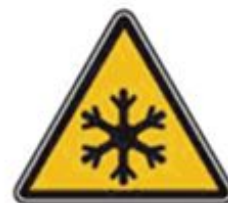
358 Осторожно. Холод