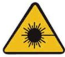
351 Опасно. Лазерное излучение