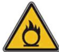
352 Опасно. Окислитель