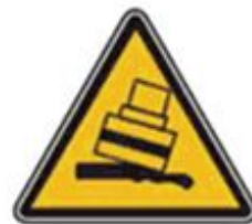
364 Осторожно. Возможность опрокидывания