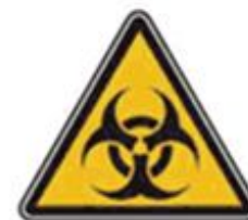
357 Осторожно. Биологическая опасность (Инфекционные вещества)