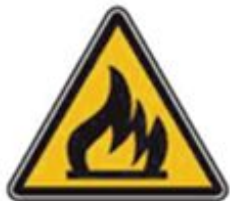
342 Опасно. Легковоспламеняющиеся вещества