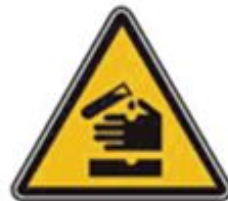
345 Опасно. Едкие и коррозионные вещества