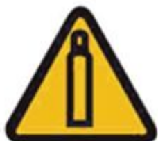
360 Газовый балон