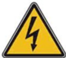
349 Опасность поражения электрическим током