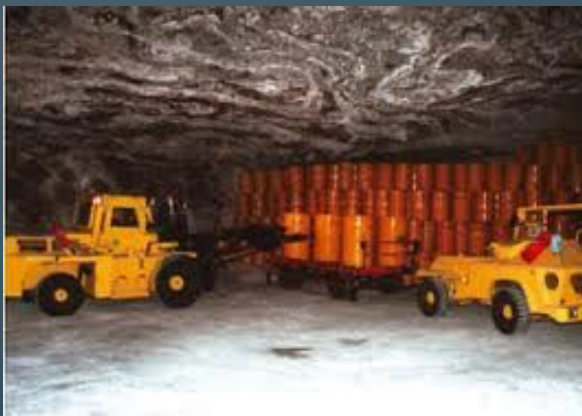
предприятия по захоронению радиоактивных отходов