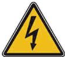
349 Опасность поражения электрическим током