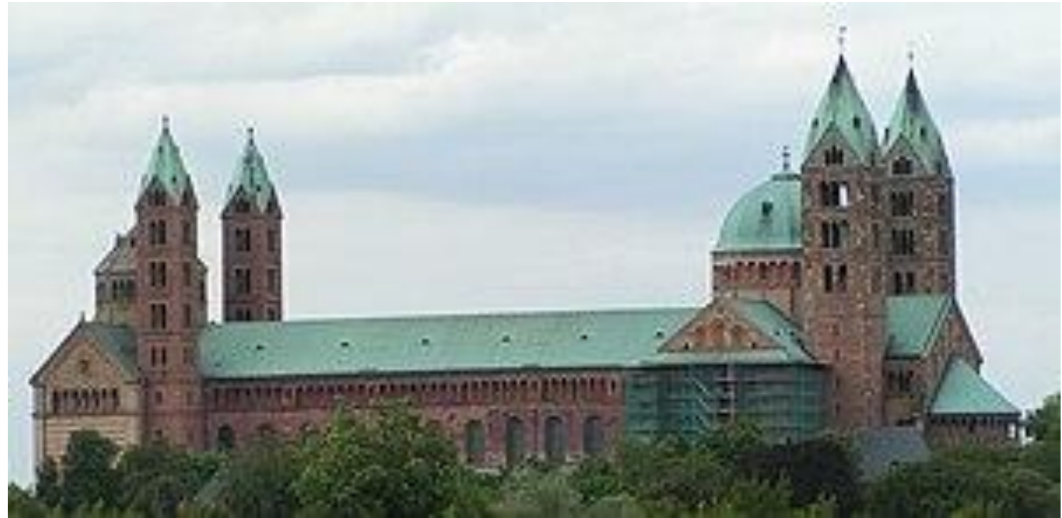
Шпайерски й собор