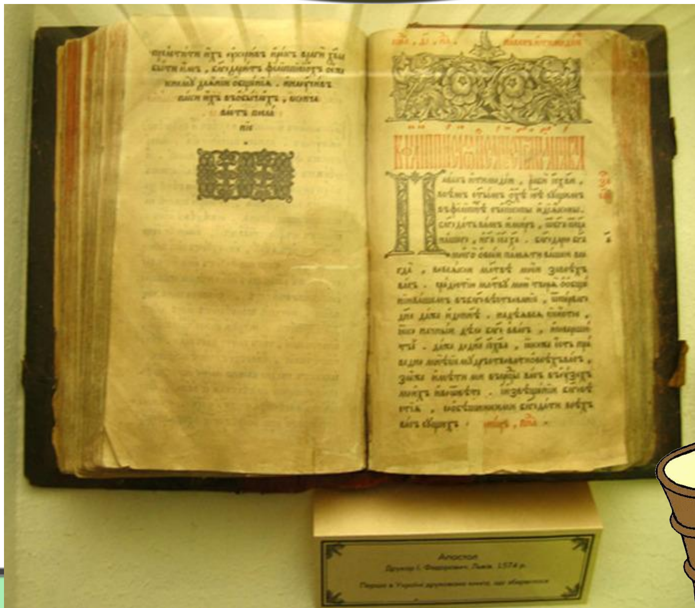
Апостол Дружеское издательство, Львов, 1574 г. Первый в Украине друкований апостол, що збереглися