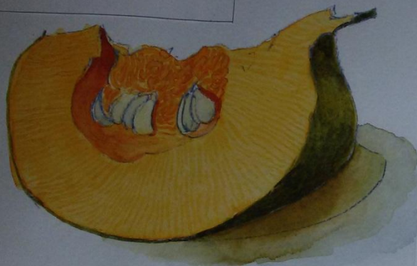
Моисеенко Кирилл, Н4 14 лет