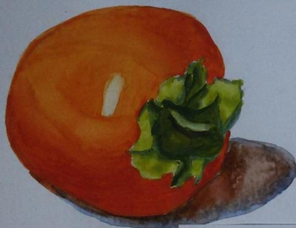
Моисеенко Кирилл, Н4 14 лет