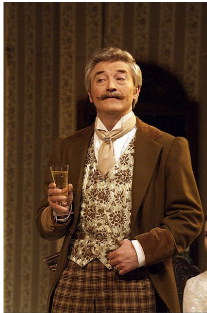
Африкан Саввич Коршунов