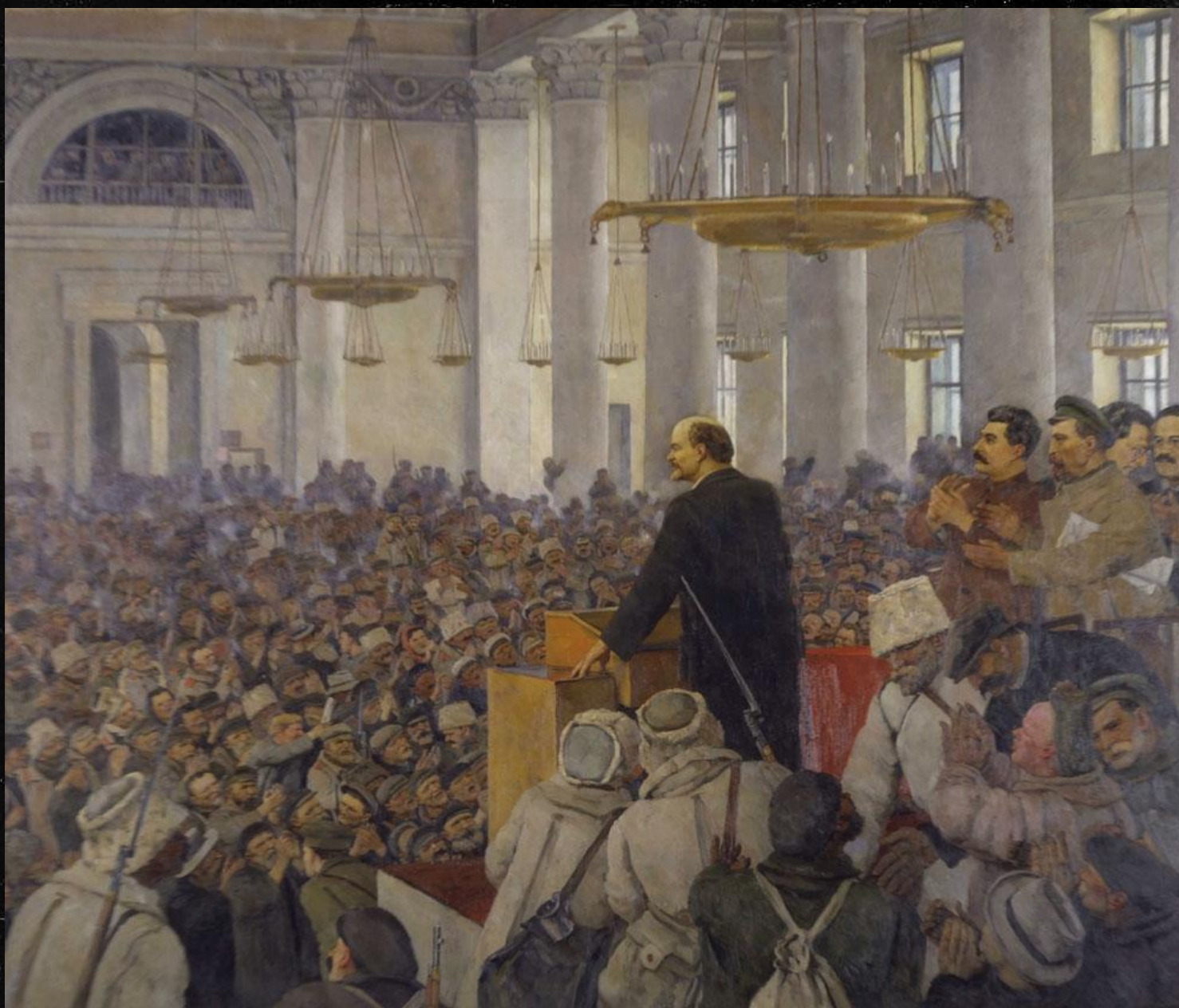
К. Юон – Первое появление В.И. Ленина на заседании Петросовета в Смольном 25 октября 1917 (1935)