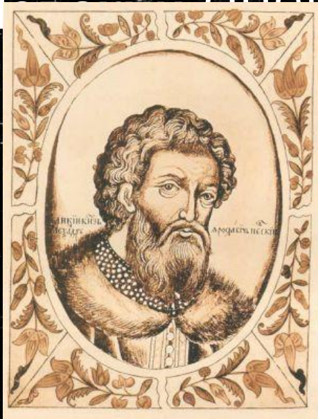
П. Д. Корин Александр Невский (1942)