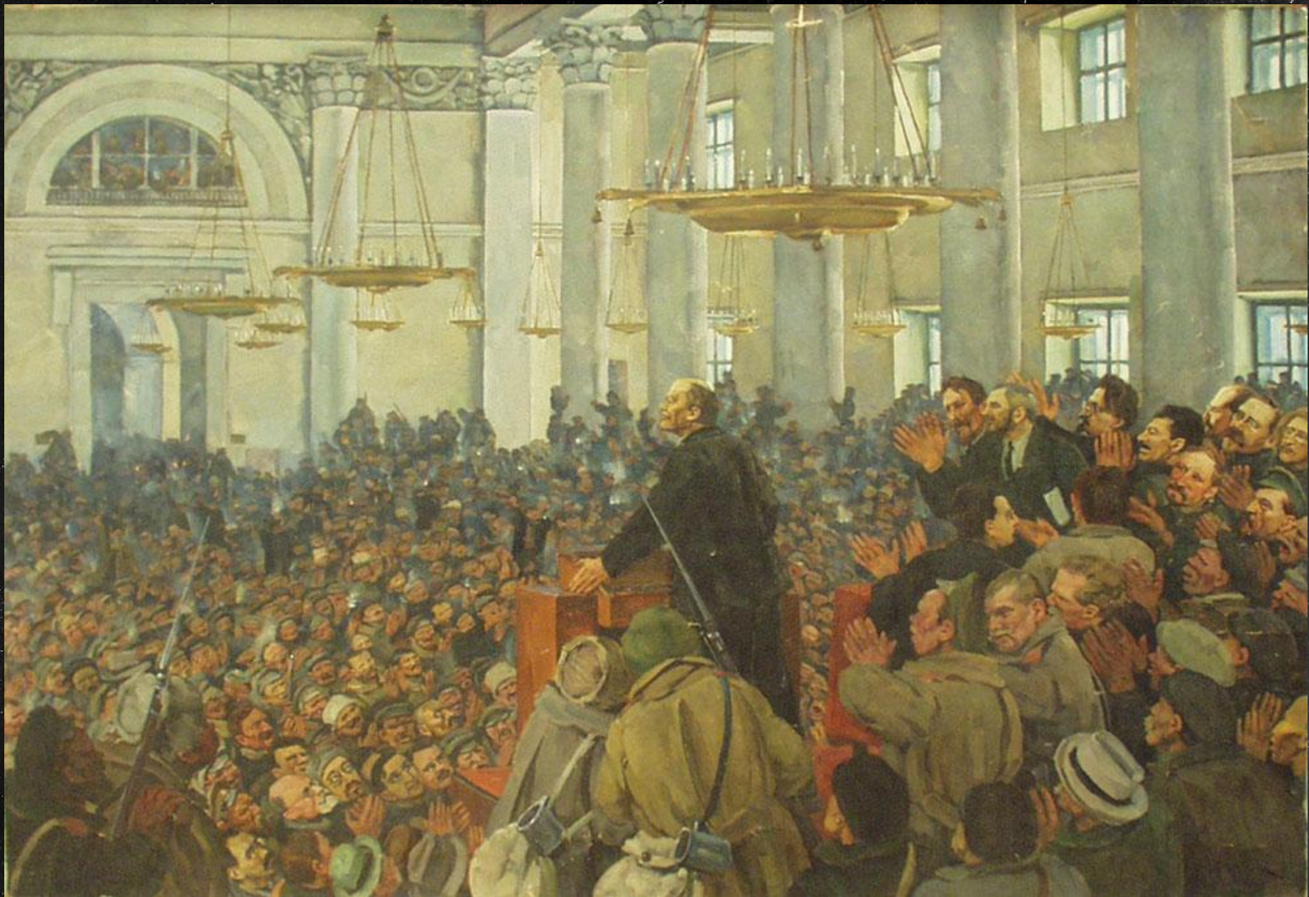
К. Юон – Первое появление В.И. Ленина на заседании Петросовета в Смольном 25 октября 1917 (1927)