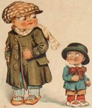
Большевикъ и меньшевикъ.