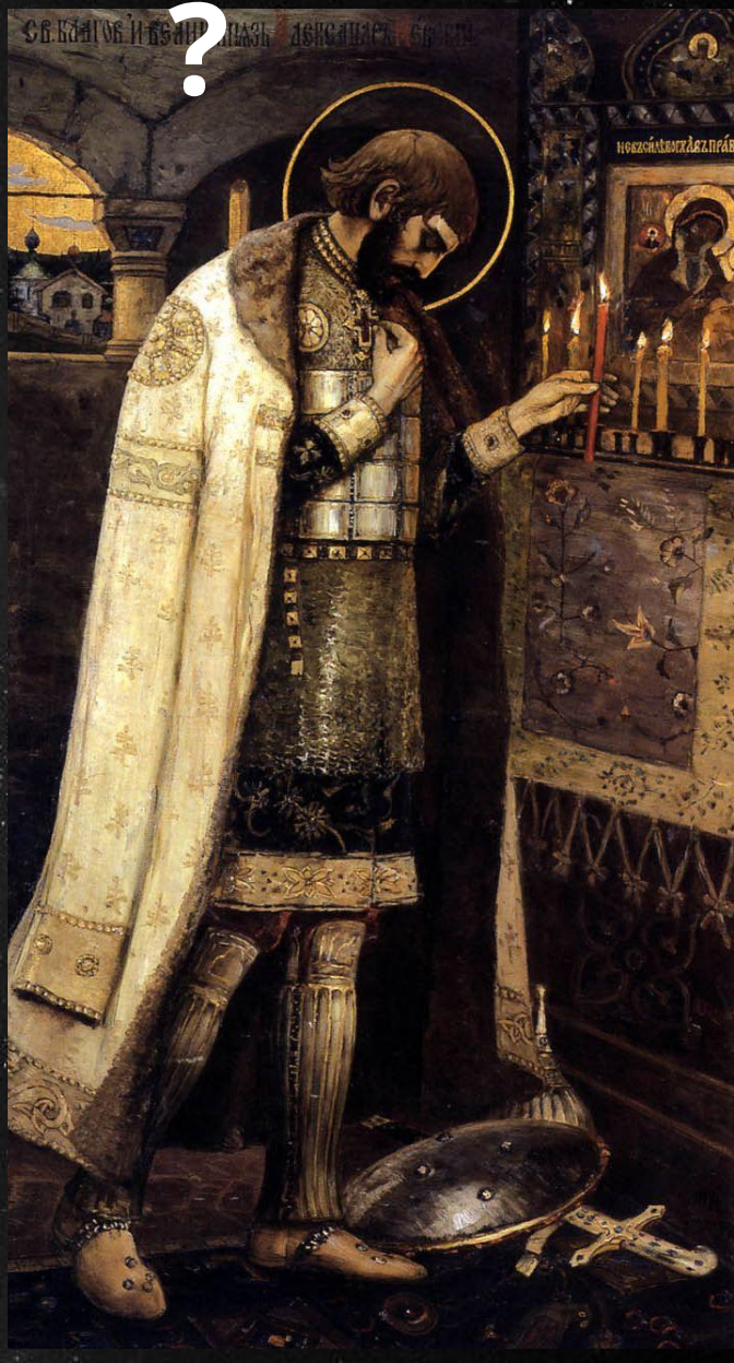
М. В. Нестеров Князь Александр Невский (1905)