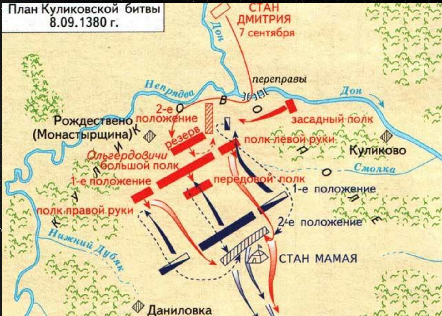
План Куликовской битвы 8.09.1380 г.

http://hiztory.ru/rus13-15vek/kulikova-bitva.html