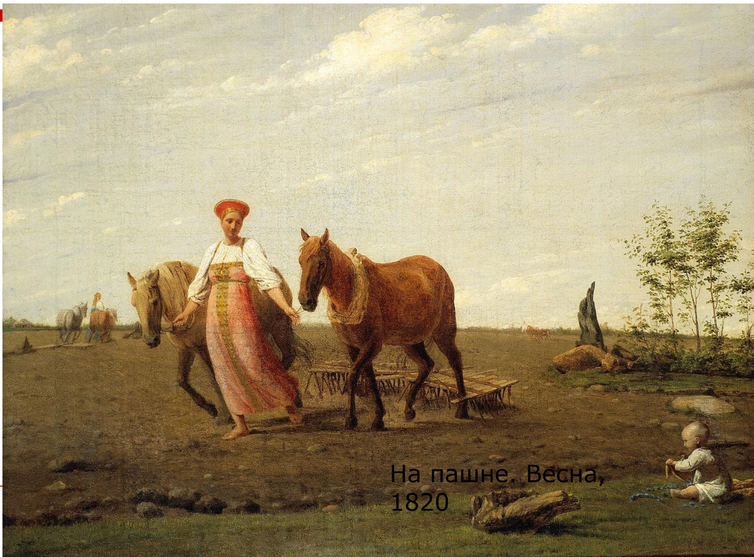
На пашне. Весна, 1820