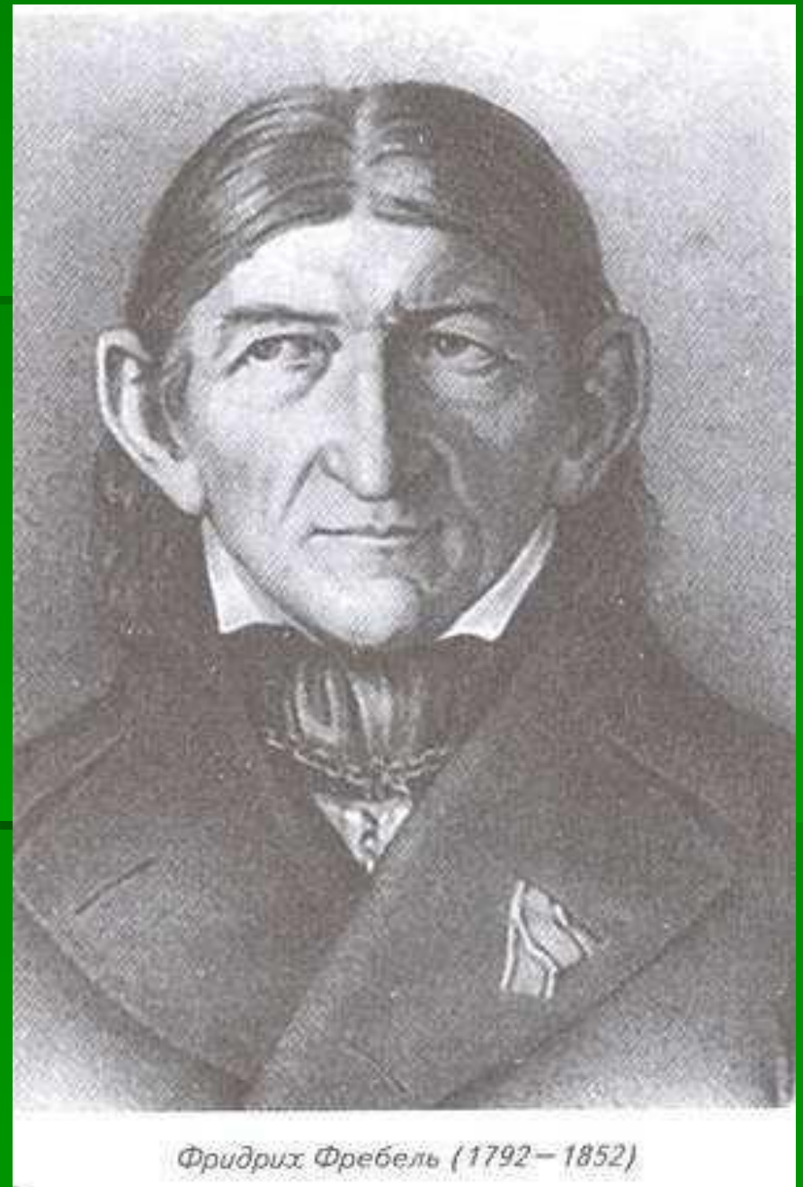
Фридрих Фрөбелъ (1792—1852)