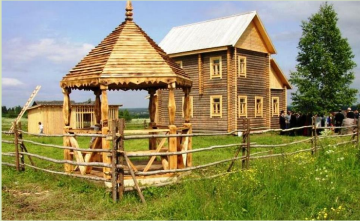
Дом-музей Ефима Честнякова