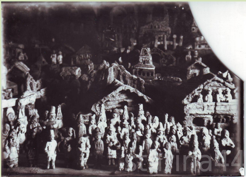
Фотография «глиняного» театра Е. Честнякова