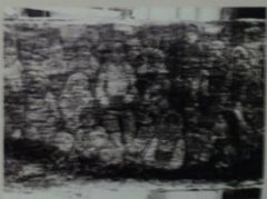
Картина «Слушают гусли» до реставрации

После смерти Ефима Честнякова жители его родной деревни Шаблово разобрали всё, что оставалось на тот момент в доме художника. Фрагменты картины попали к разным людям, но сохранились и были впоследствии переданы владельцами сотрудникам Костромского государственного художественного музея-заповедника . В настоящее время «Город Всеобщего Благоденствия» входит в его коллекцию и экспонируется в Романовском музее города Костромы .