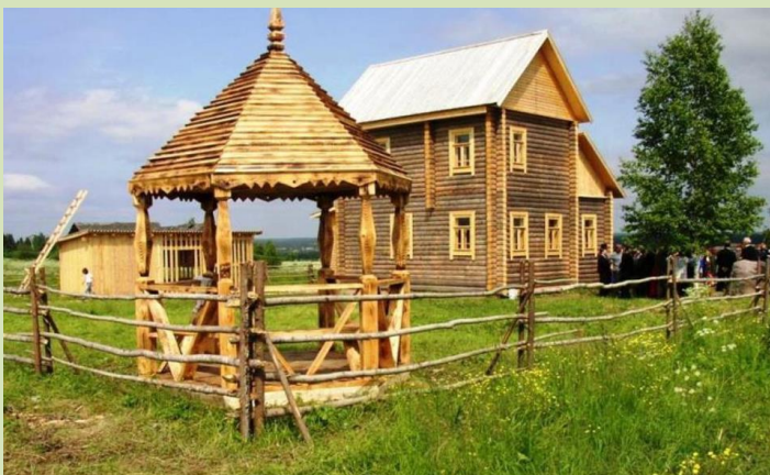
Дом-музей Ефима Честнякова