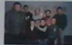
Загін №7 «Переманці»