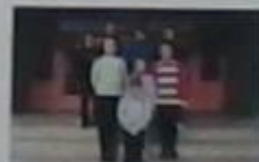
Загін №8 «Партизани»