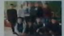
Загін №10 «Пустушки»