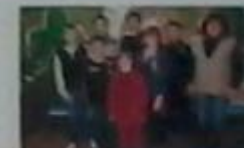
Загін №11 «Смисливі»