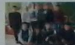
Загін №10 «Пустушечки»