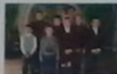
Загін №4 «Проліски»