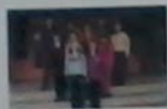
Загін №1 «Буратино»