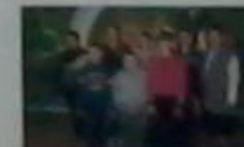
Загін №12 «Знайки»