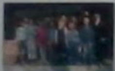
Загін №3 «Панаски»