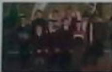
Загін №5 «Кришталі»