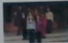
Загін №1 «Буратино»