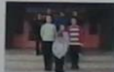
Загін №8 «Партизани»