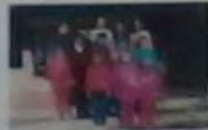
Загін №2 «Нескороно»