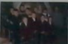
Загін №6 «Совалетки»