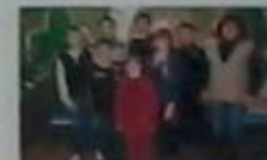
Загін №11 «Смолани»