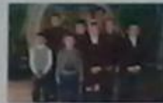
Загін №4 «Проліски»