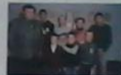
Загін №7 «Переманці»