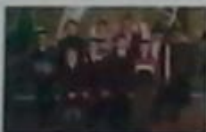
Загін №5 «Крижанці»