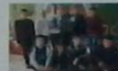
Загін №10 «Пустушки»