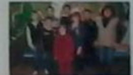
Загін №11 «Смолани»