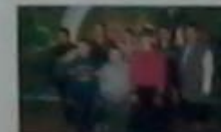
Загін №12 «Змаїли»