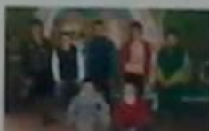
Загін №9 «Дружби»