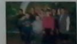
Загін №12 «Знаменці»