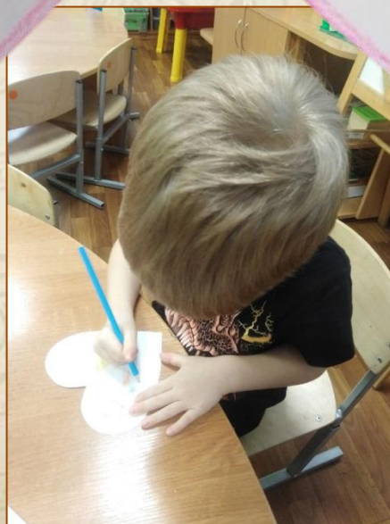
Иллюстрация Кирилла Вереник, 4г