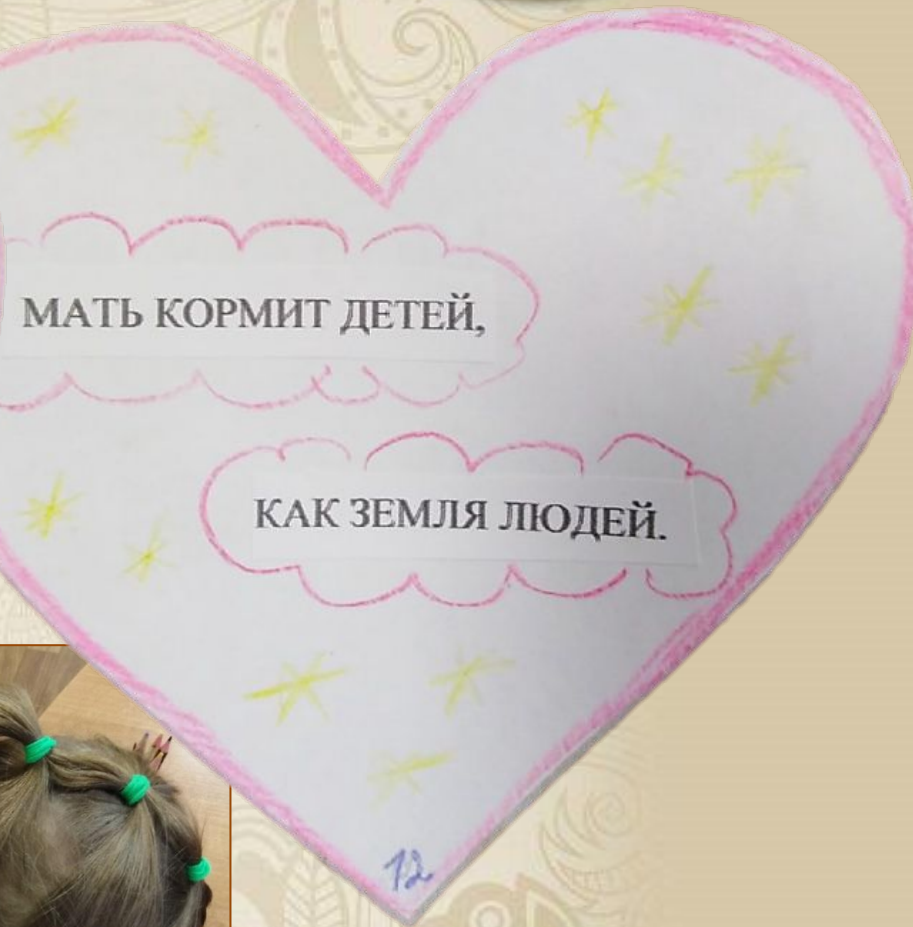
Иллюстрация Насти Червинской, 5 л