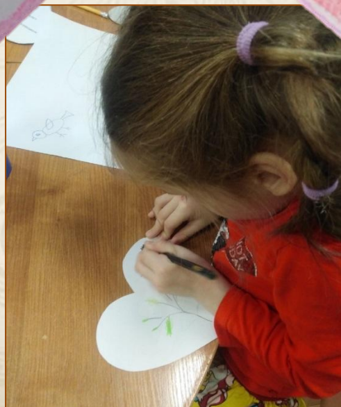
Иллюстрация Алисы Орловой, 4г