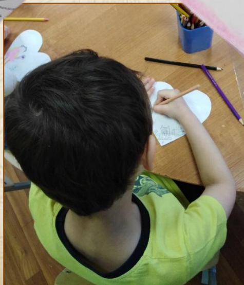
Иллюстрация Коли Васильева, 4г