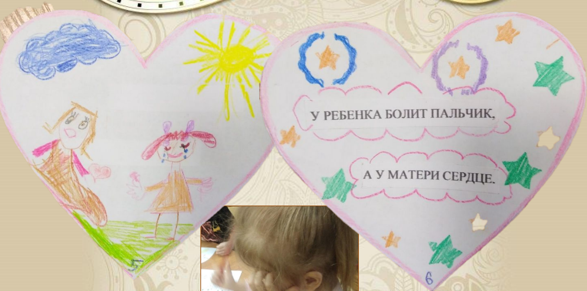
Иллюстрация Насты Червинской, 5 лет