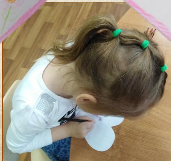
Иллюстрация Насти Червинской, 5 л