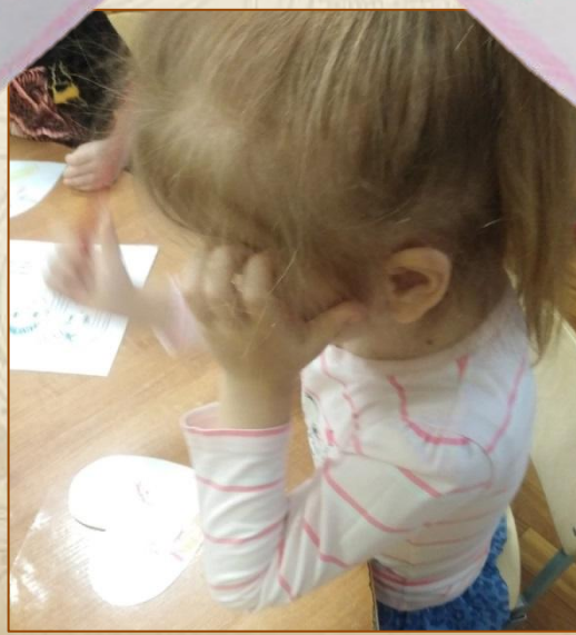
Иллюстрация Насти Червинской, 5 лет