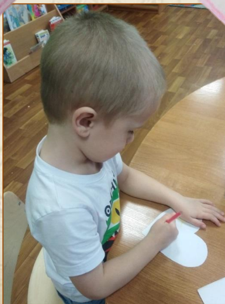
Иллюстрация Валеры Смирнова, 4 г.