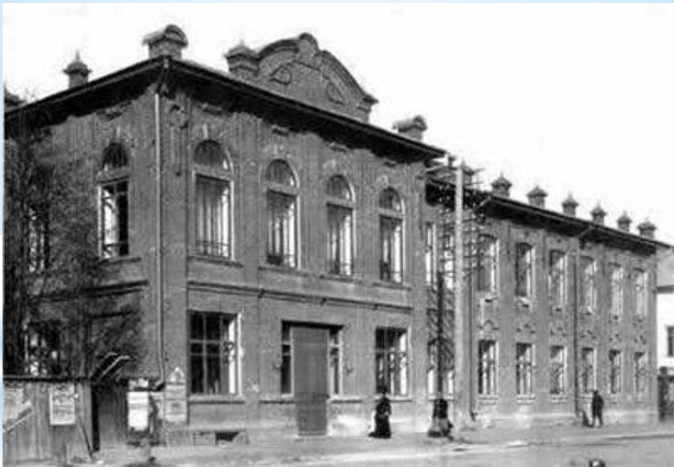
Женская гимназия (сейчас – гимназия № 3 им. А.Н.Островского). Фото нач. XX в.