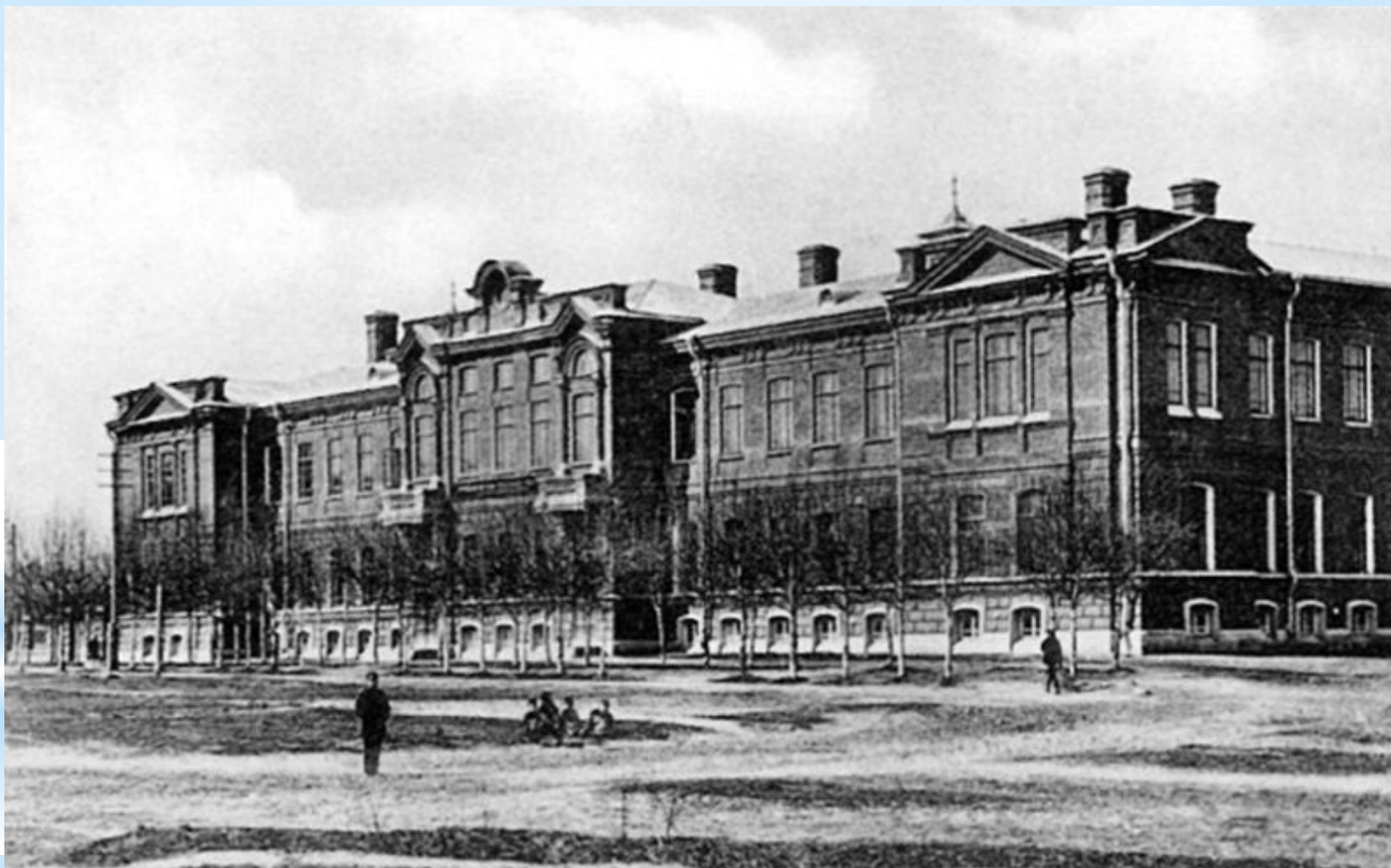
Реальное училище (сейчас - лицей им. Д.А.Фурманова). Фото нач. XX века.