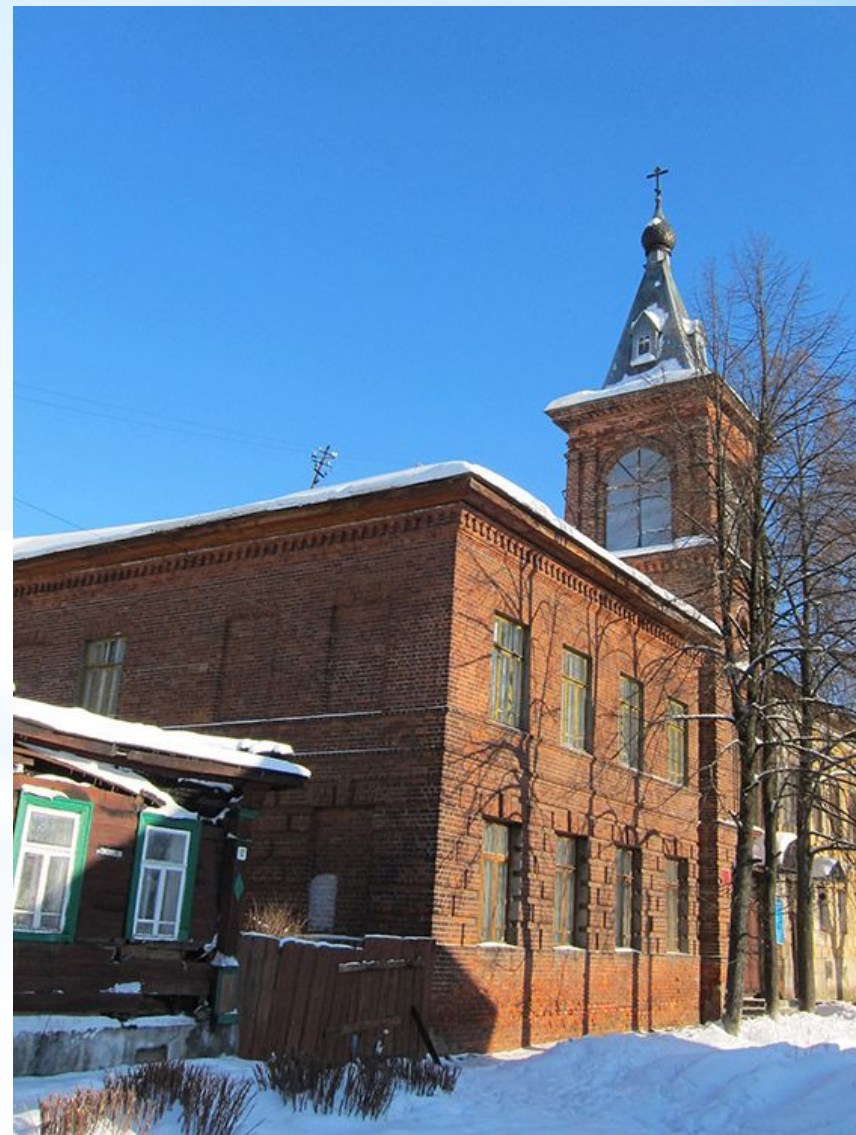
Богородицкая домашняя церковь при приюте для бедных и сирот

В 1893 - 1916 годах - священник Богородицкой церкви при приюте для бедных г.Кинешмы. В школе при приюте преподавал Закон Божий.