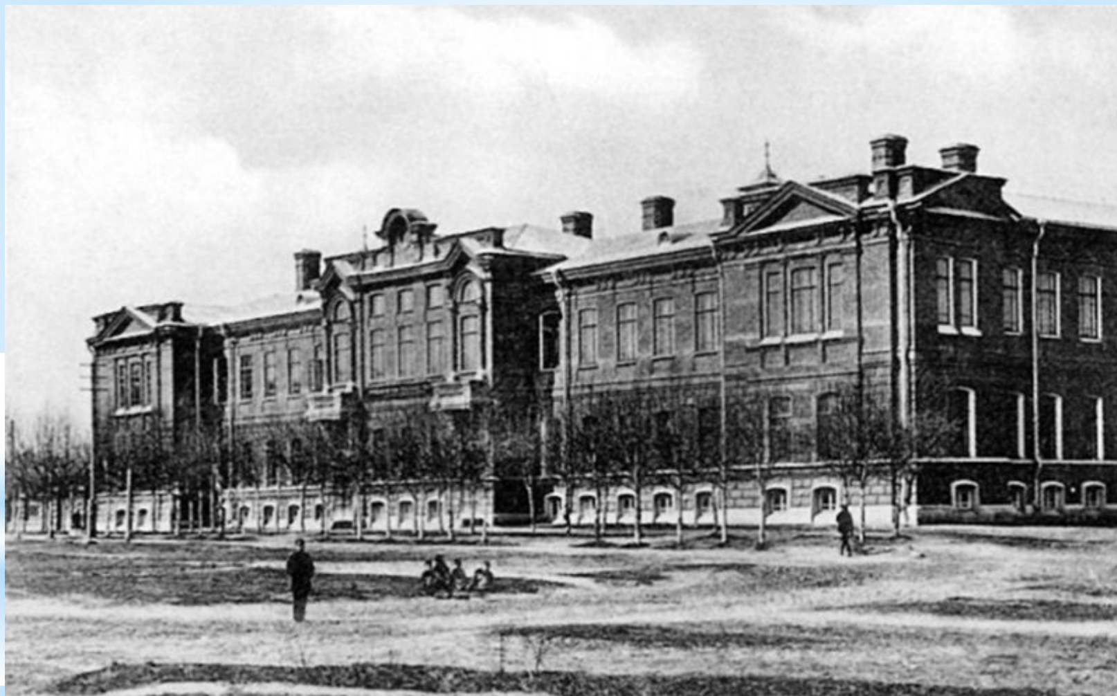
Реальное училище (сейчас - лицей им. Д.А.Фурманова). Фото нач. XX века.