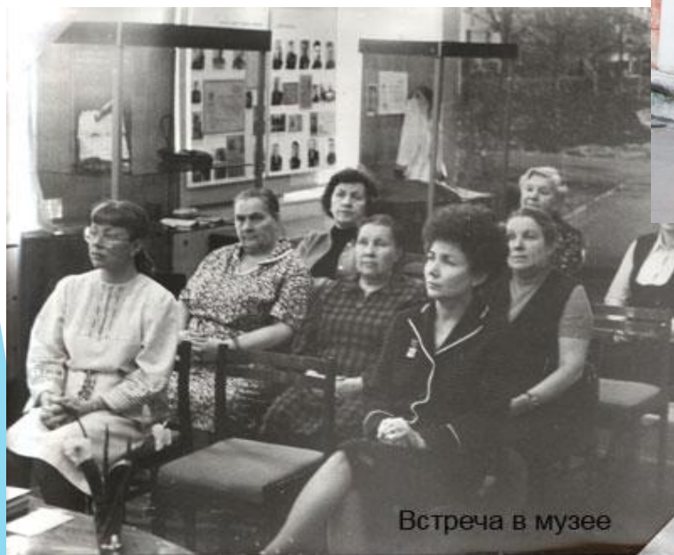
Встреча в музее