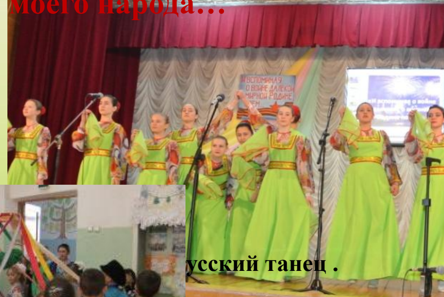
русский танец .