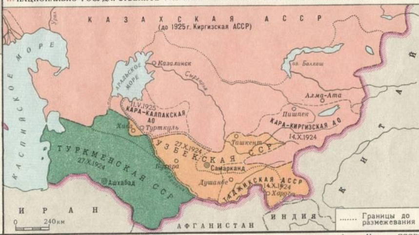
II. НАЦИОНАЛЬНО-ГОСУДАРСТВЕННОЕ РАЗМЕЖЕВАНИЕ РЕСПУБЛИК СРЕДНЕЙ АЗИИ (1924 - 1925 г.г.)