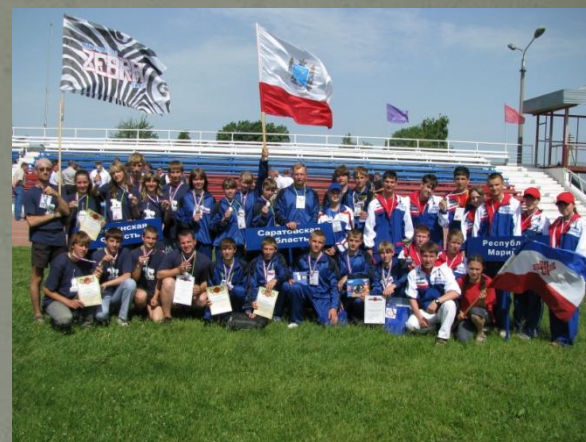
Серебряные призёры межрегиональных соревнований «Школа безопасности» г. Пенза (июнь 2009)