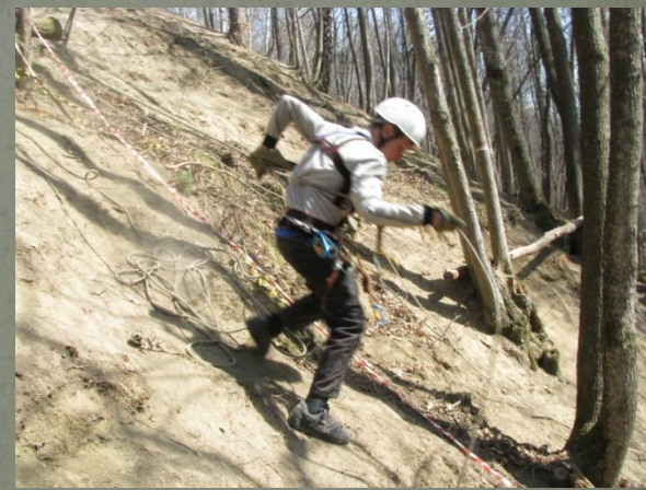
Соревнования туристской направленности