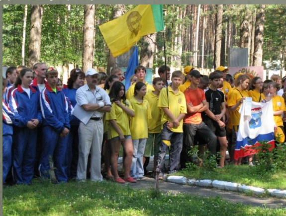
Участники III международного слёта туристов-школьников г. Брянск (июль 2009)