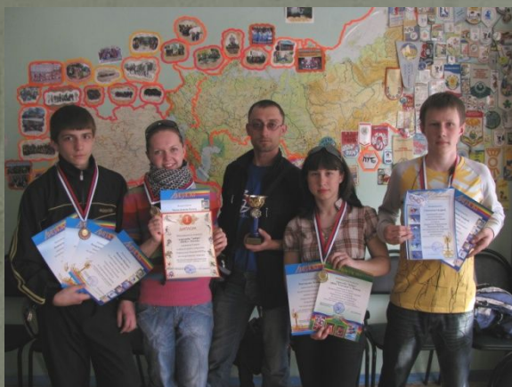
Чемпионы области по спортивному туризму (апрель 2009)