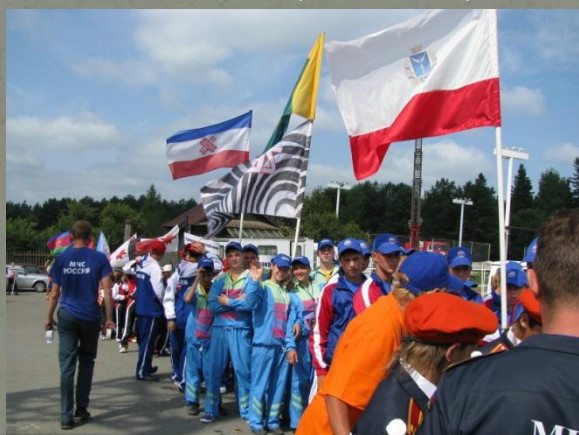
Финалисты X Всероссийских соревнований «Школа безопасности» г. Ижевск (август 2009)