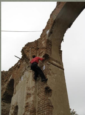
«Мы и Горы» скалолазание