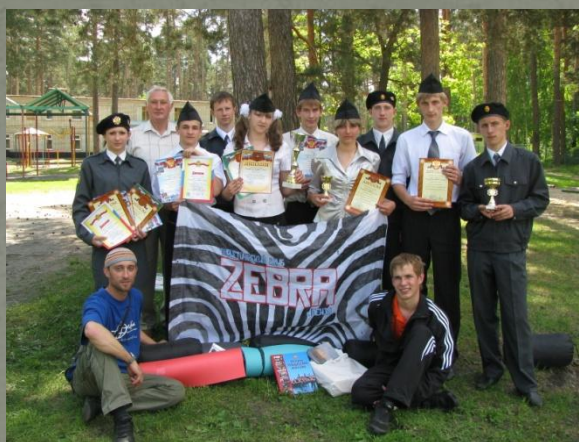
Чемпионы области по «Школе безопасности» (май 2009)