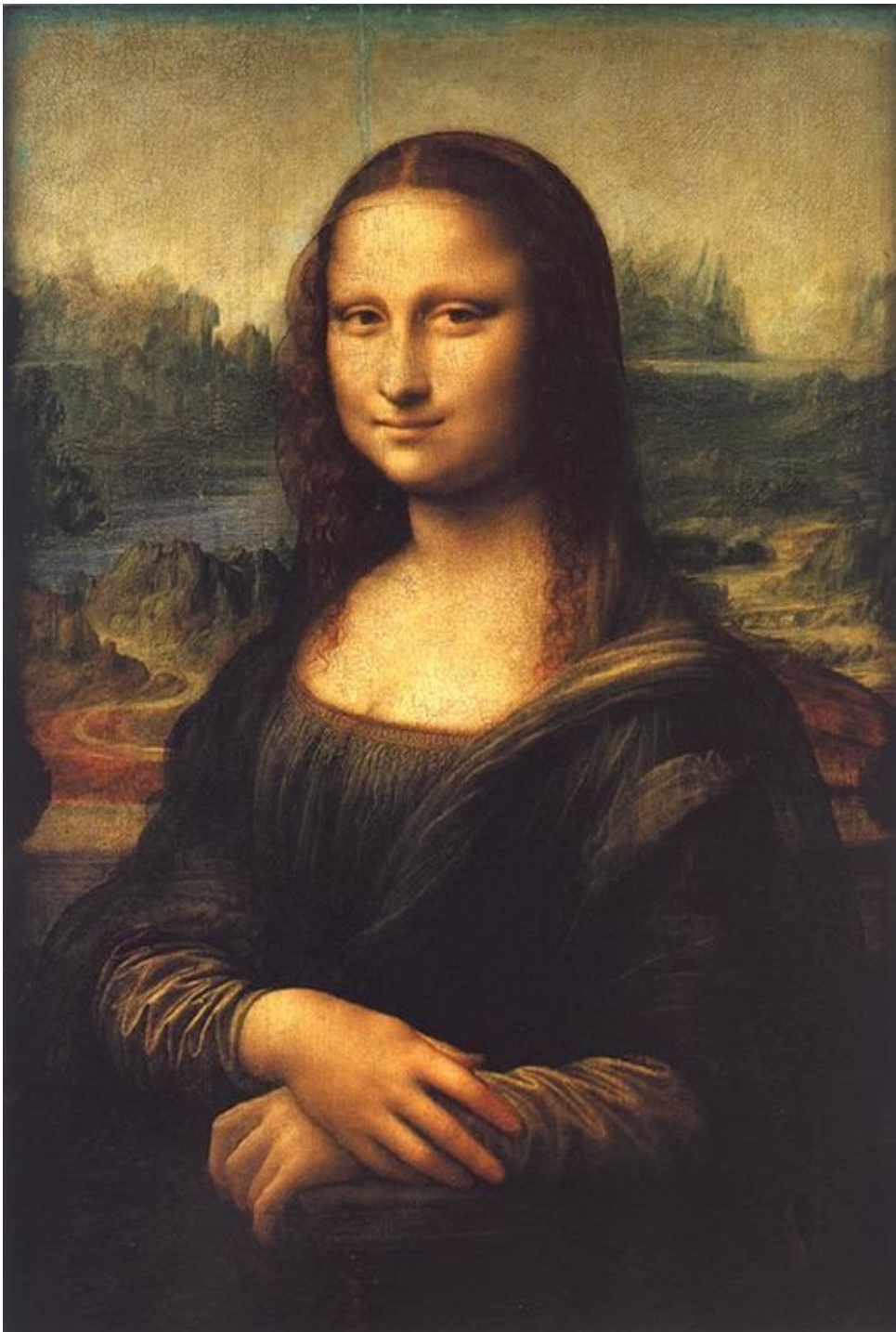
Леонардо да Винчи. Мона Лиза.