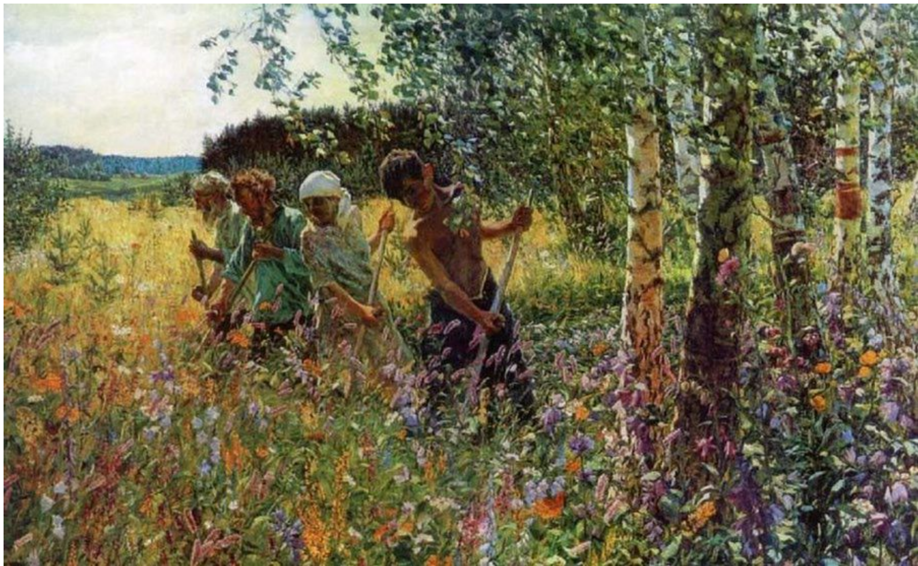
А.Пластов. Сенокос 1945г