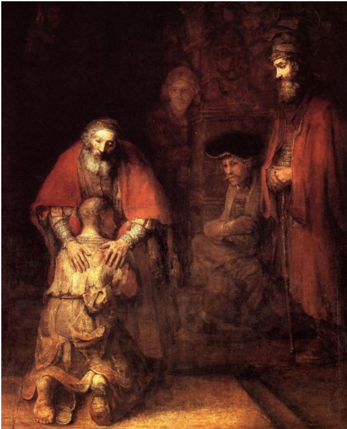
Рембрандт Харменс ван Рейн (1606—1669)

Художники 18-19 веков рисовали классические, библейские сюжеты.