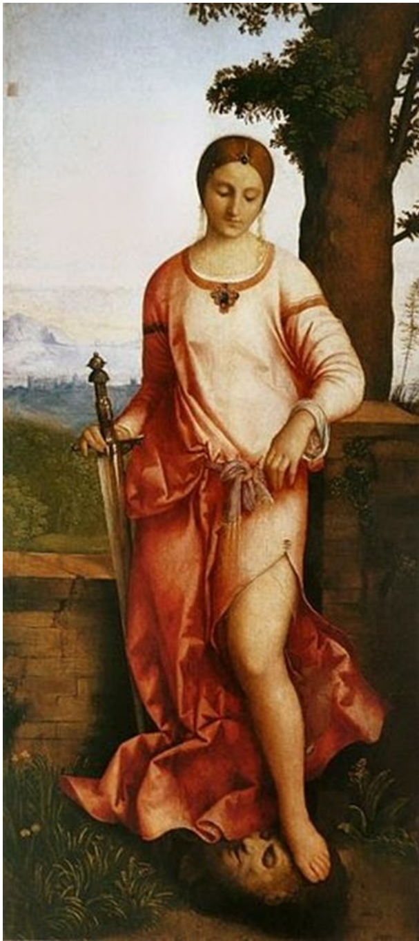
Джорджоне (1477-1510) Юдифь с головой Олоферна 1504г.

Эпоха итальянского Возрождения наряду со скульптурными образами подарила миру множество живописных произведений.