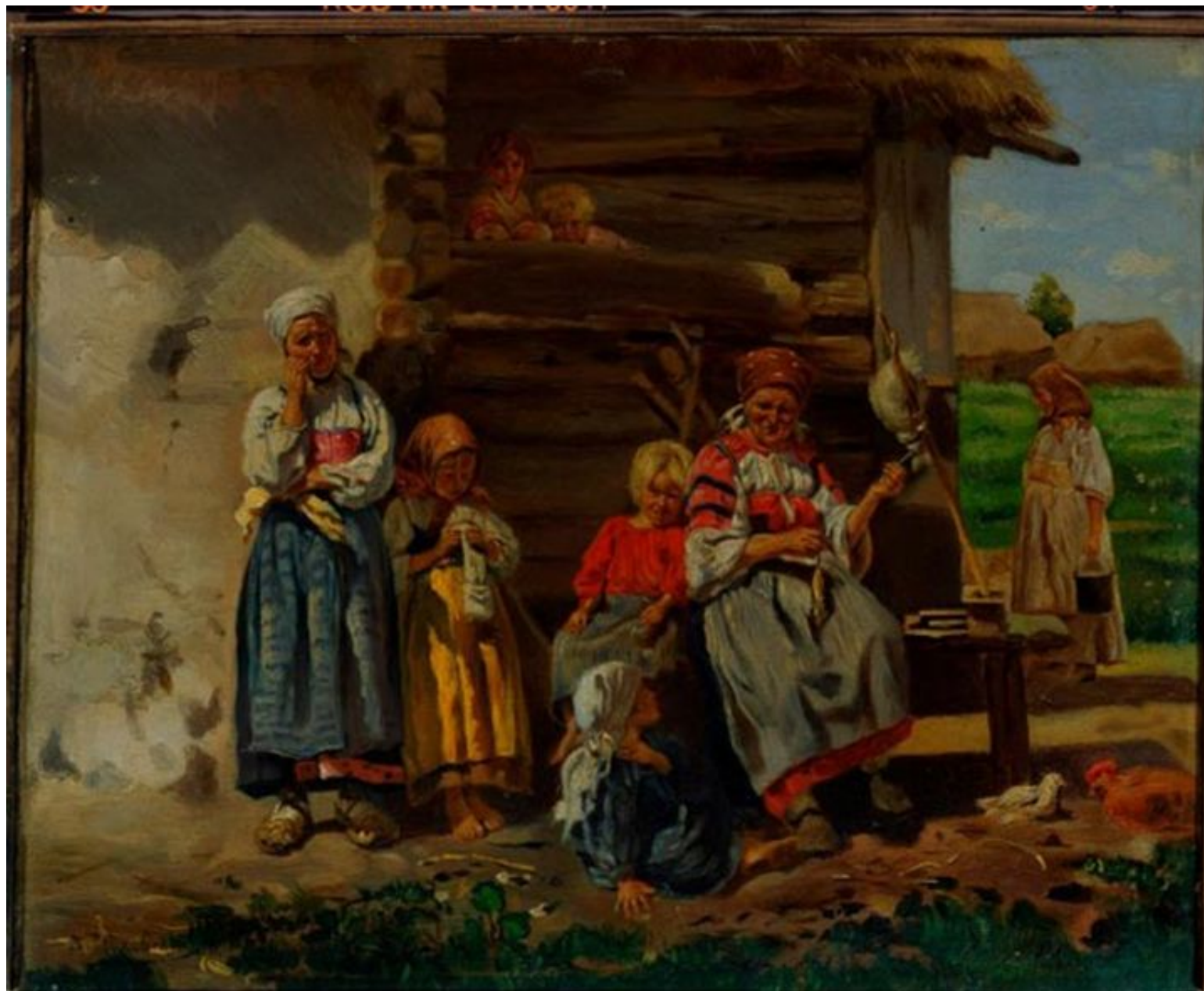
Маковский В.Е. В деревне. 1898