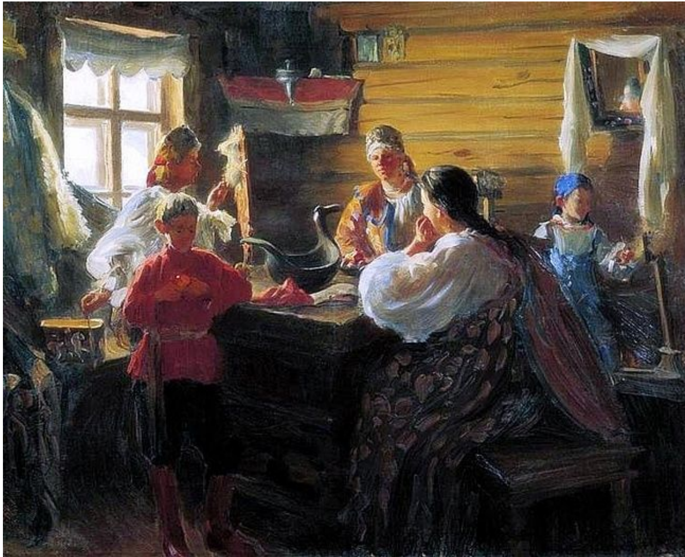
Иван Куликов. Зимним Вечером

Русские художники 19 века стремились через изображение человека создать образ России