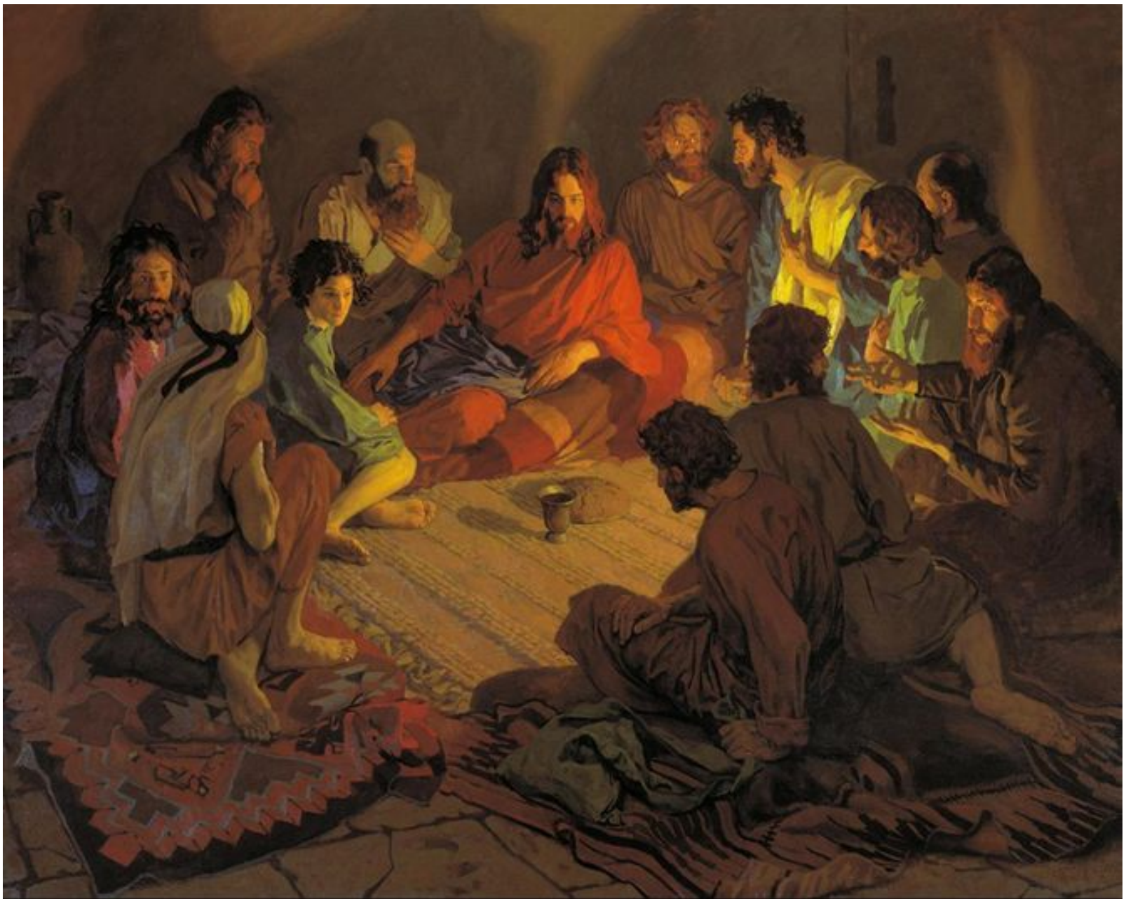
Павел Попов "Тайная вечеря"