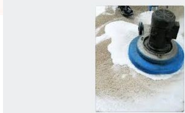
Стирка ковров 170 руб/кв.м Группа