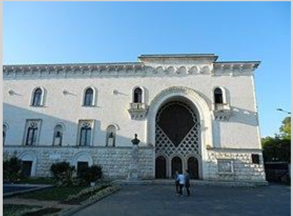
Абхазский государственный драматический театр им. С. Чамба

После установления в Абхазии советской власти в 1930 г. в Сухуме был открыт драматический театр.