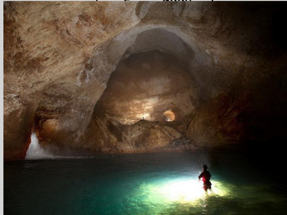
пещера Крубера - Воронья