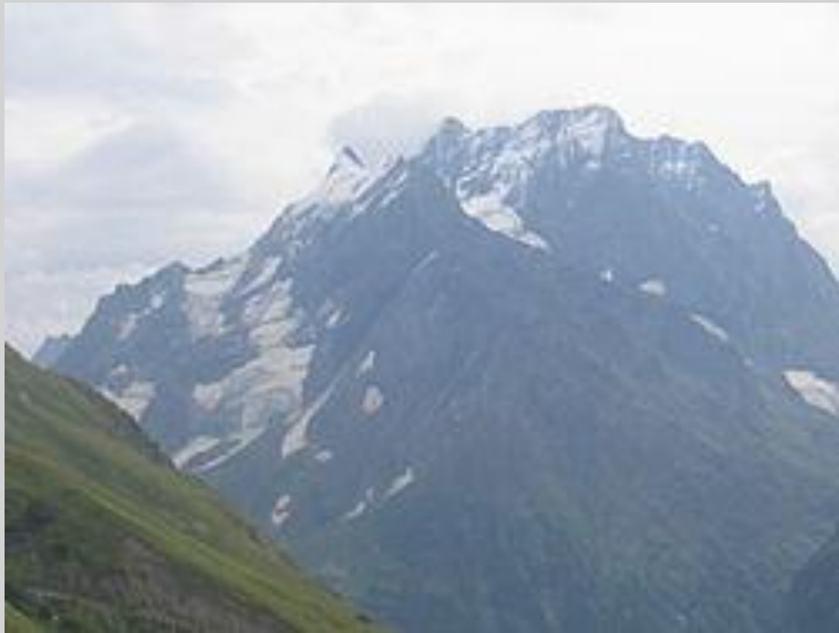
Гора Домбай – Ульген