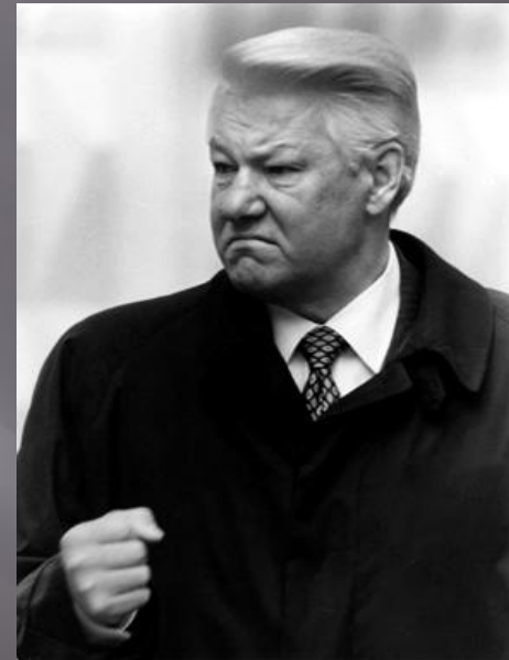
Президент РФ 1991-1999