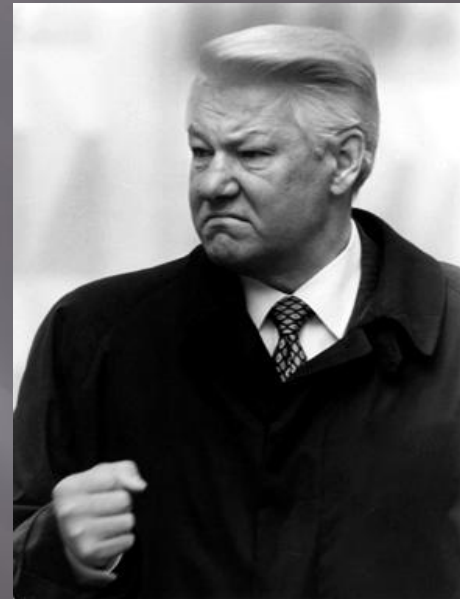
Президент РФ 1991-1999