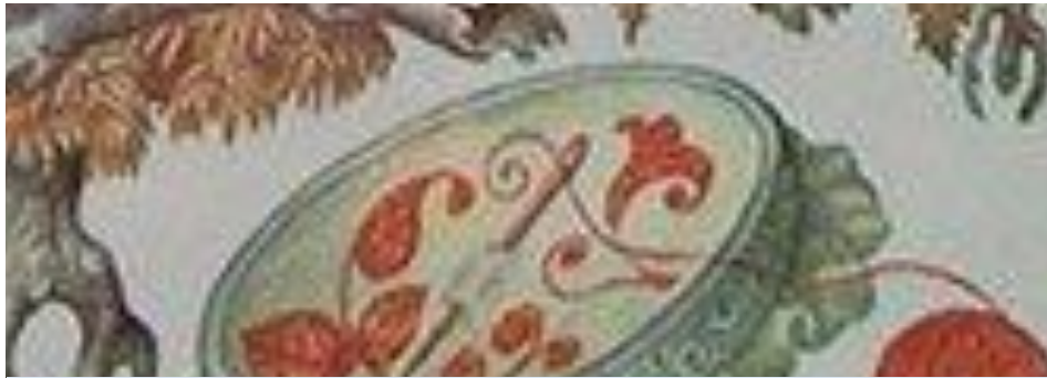
золотое пялечко да иголочка, которая сама вышивает