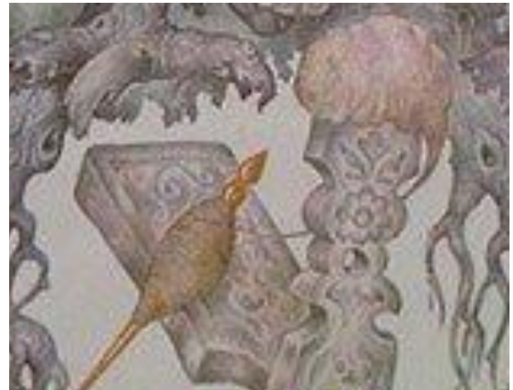
серебряное донце, золотое веретёнце