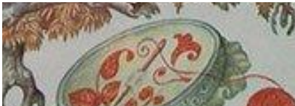
золотое пялечко да иголочка, которая сама вышивает