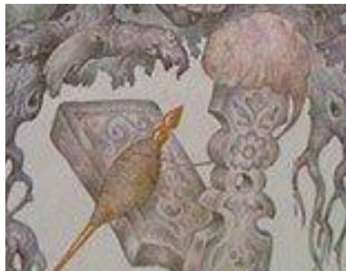
серебряное донце, золотое веретёнце