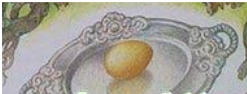
серебряное блюдо и золотое яичко