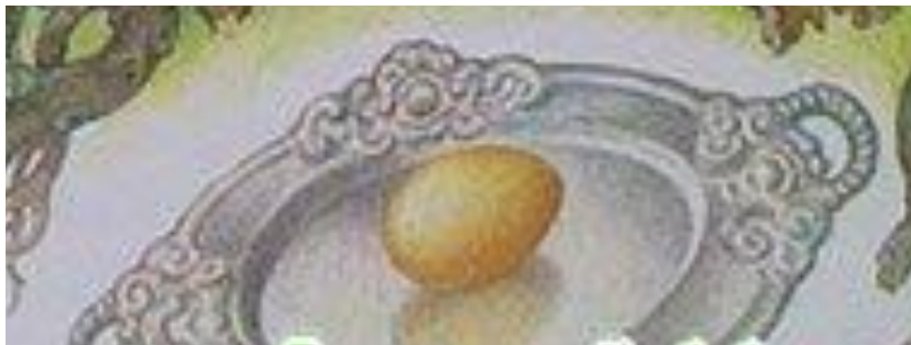
серебряное блюдо и золотое яичко