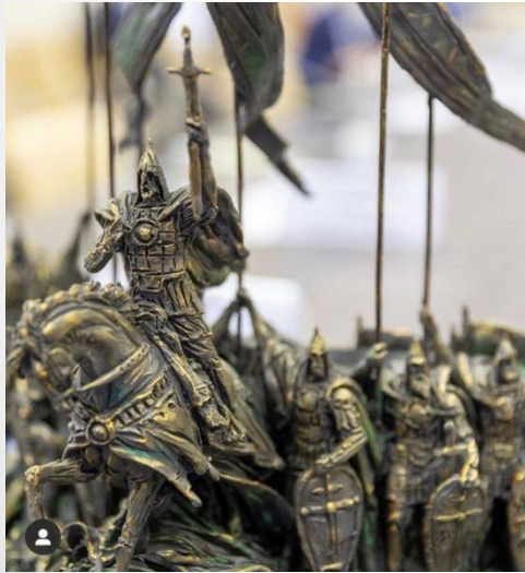
m.v_007 Макет монумента, посвящённого победе благоверного князя Александра Невского над ливонскими рыцарями.

Очень красивая и талантливая экспозиция. Идея нашего Владыки Тихона @metropolitan_tikhon_shevkunov . Предполагается, что памятник будет установлен в следующем году в водах Чудского озера 🇷🇺. Надеюсь, у нас всё получится 🙏.