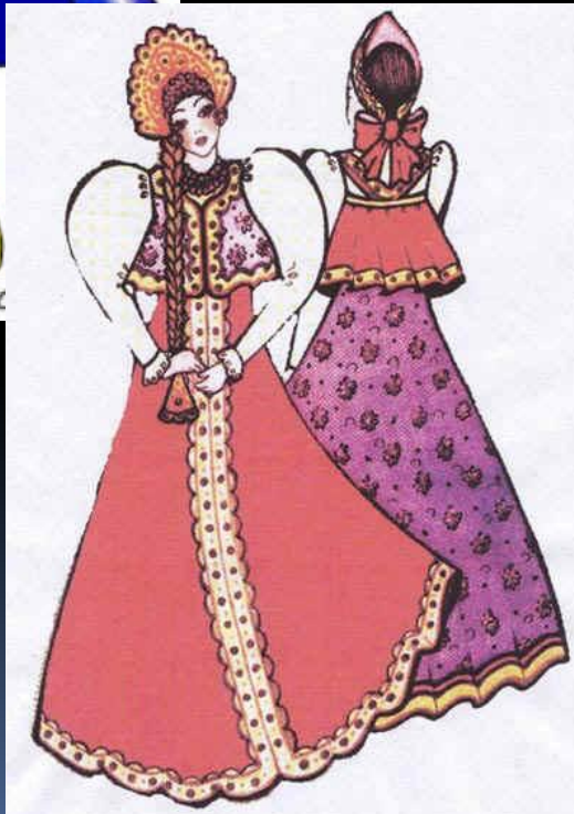
ЛЕТНИЙ ДЕВИЧИЙ КОСТЮМ (ЕПАНЕЧКИ)