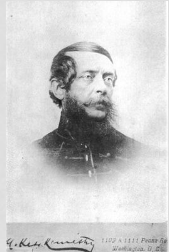
Лайош Кошут в 1851 году