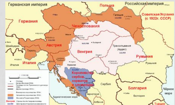
Карта распада Австро-Венгрии в 1919—1920 годах