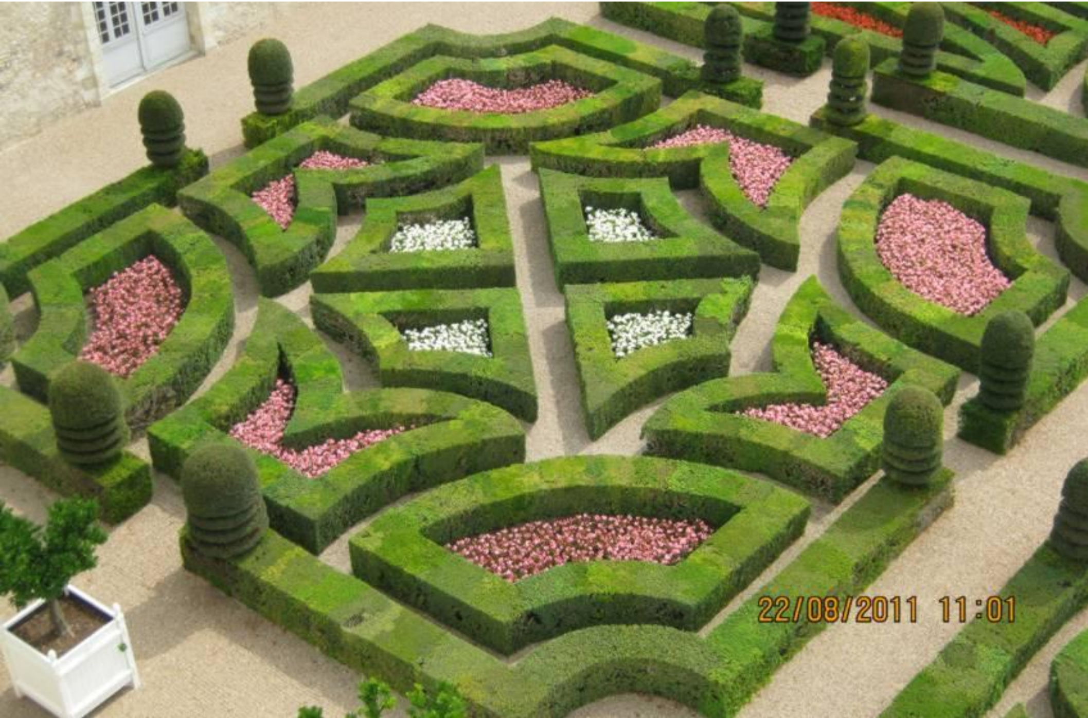
• Сады Вилландри. Непостоянная любовь