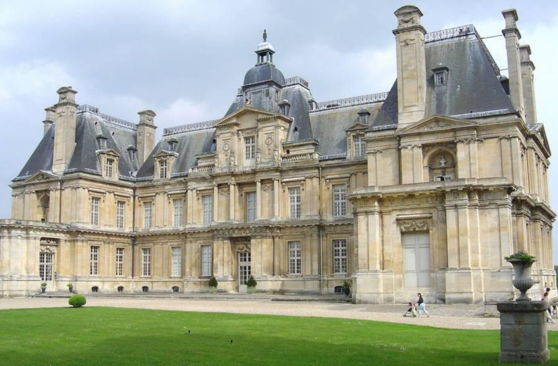
• Ф.Мансар. Мезон-Лафит. 1650г.