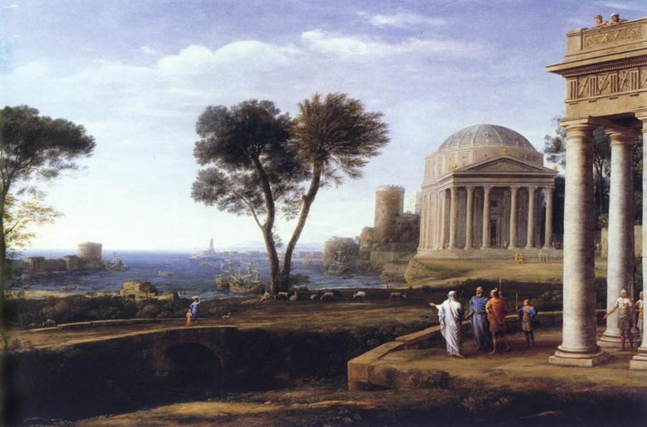
• Пейзаж с Энеем на Делосе. 1672г.