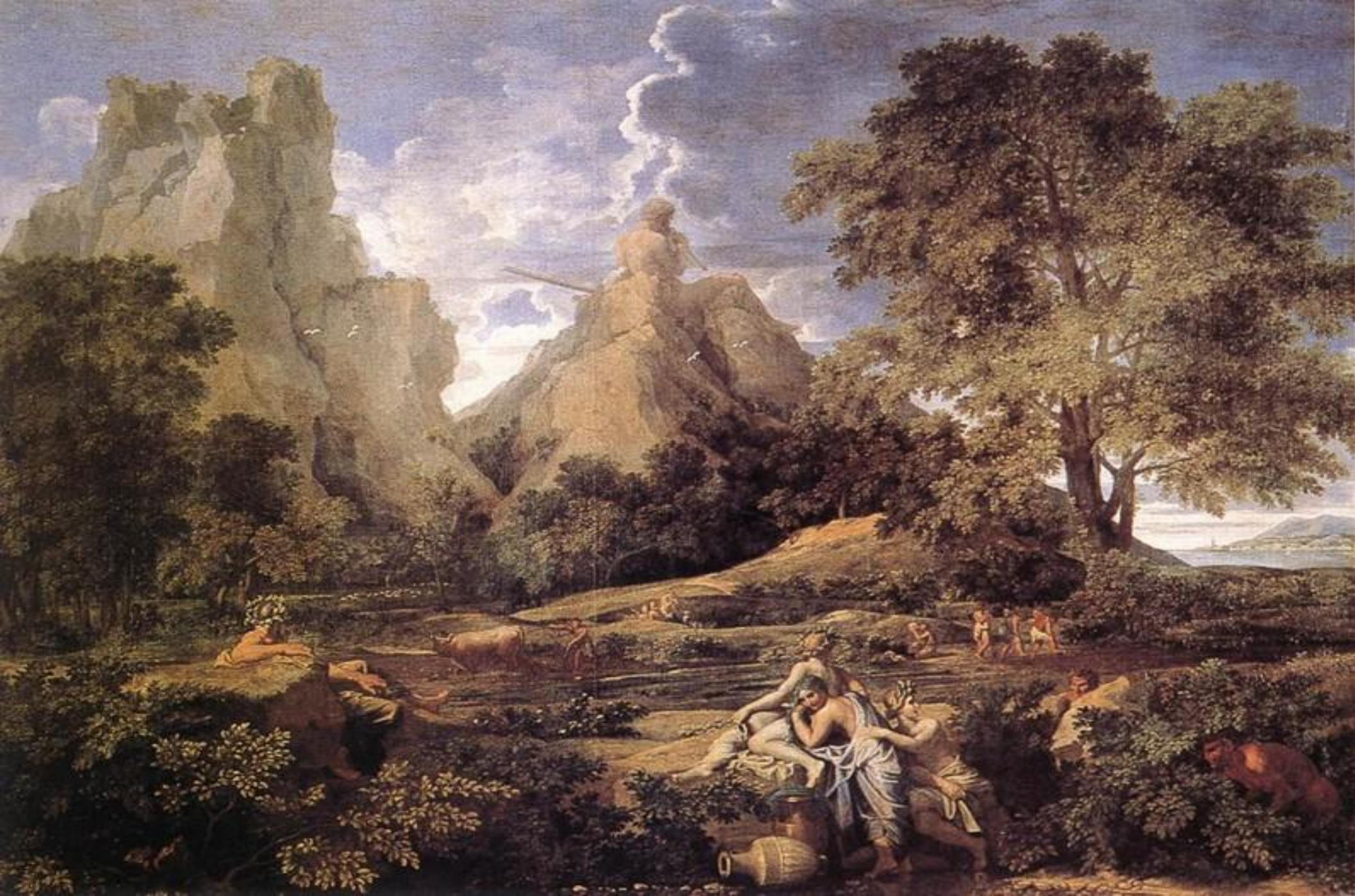
• Пейзаж с Полифемом. 1649г.