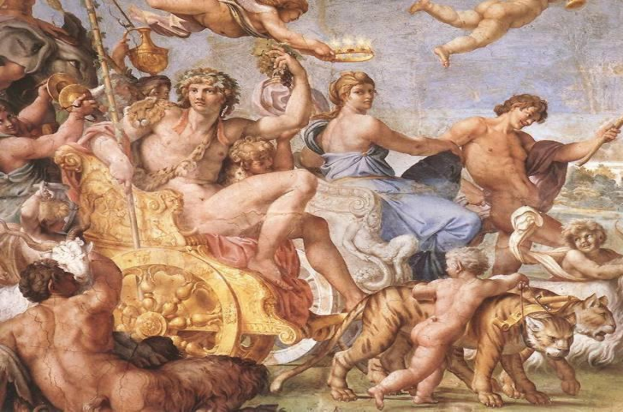
• Братья Каррачи. Триумф Вакха.