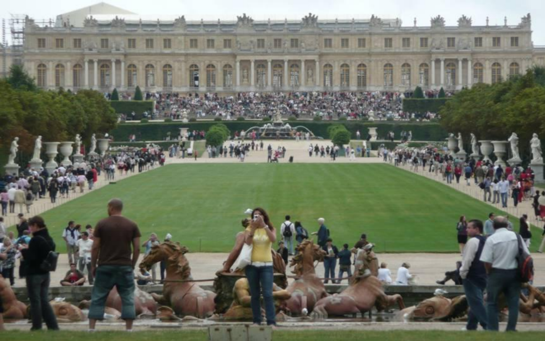
Версаль. 17В. Жюль Ардуэн-Мансар, Луи Лево, Андре Ленотр