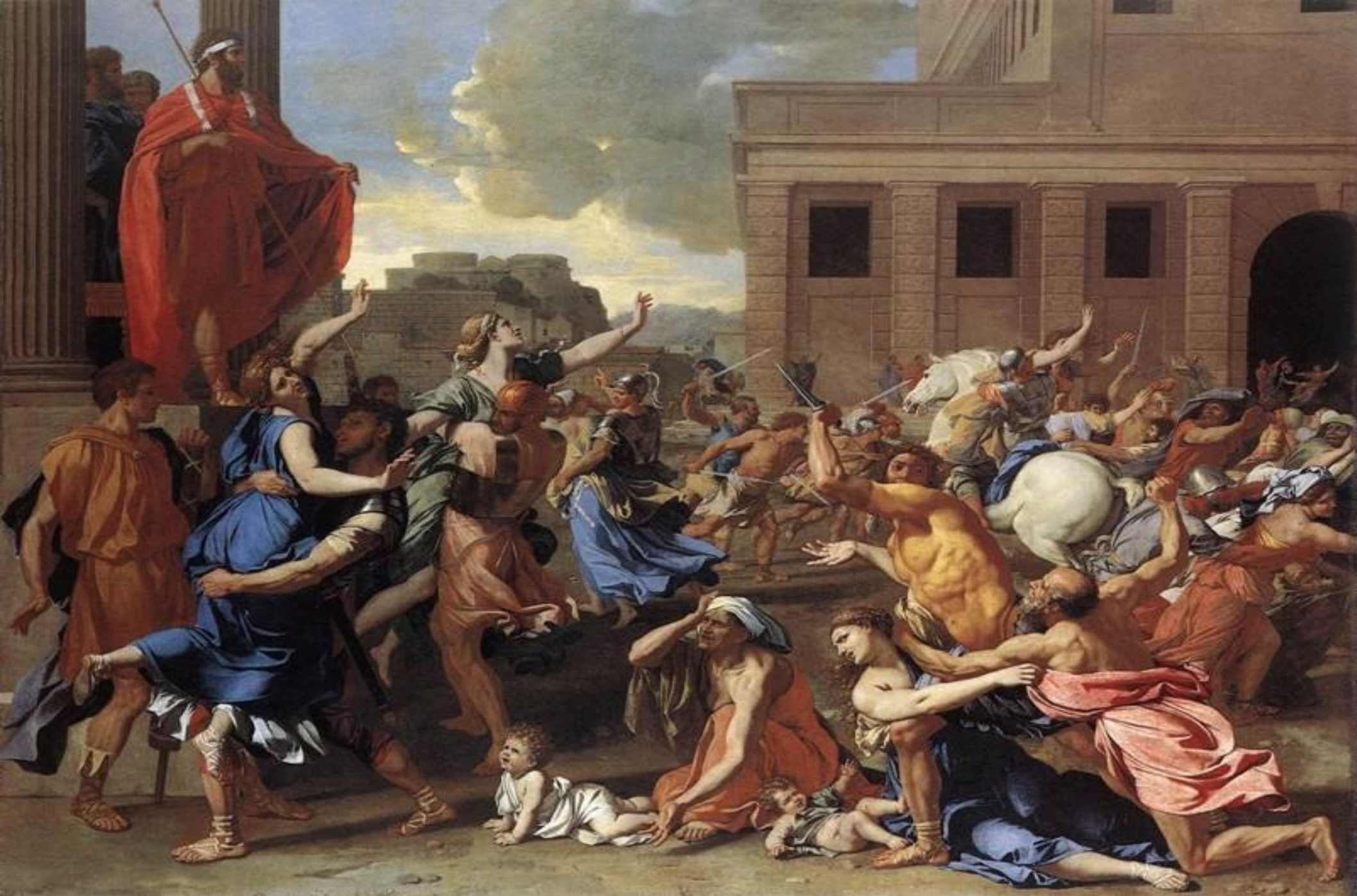
• Похищение сабинянок. 1635г.