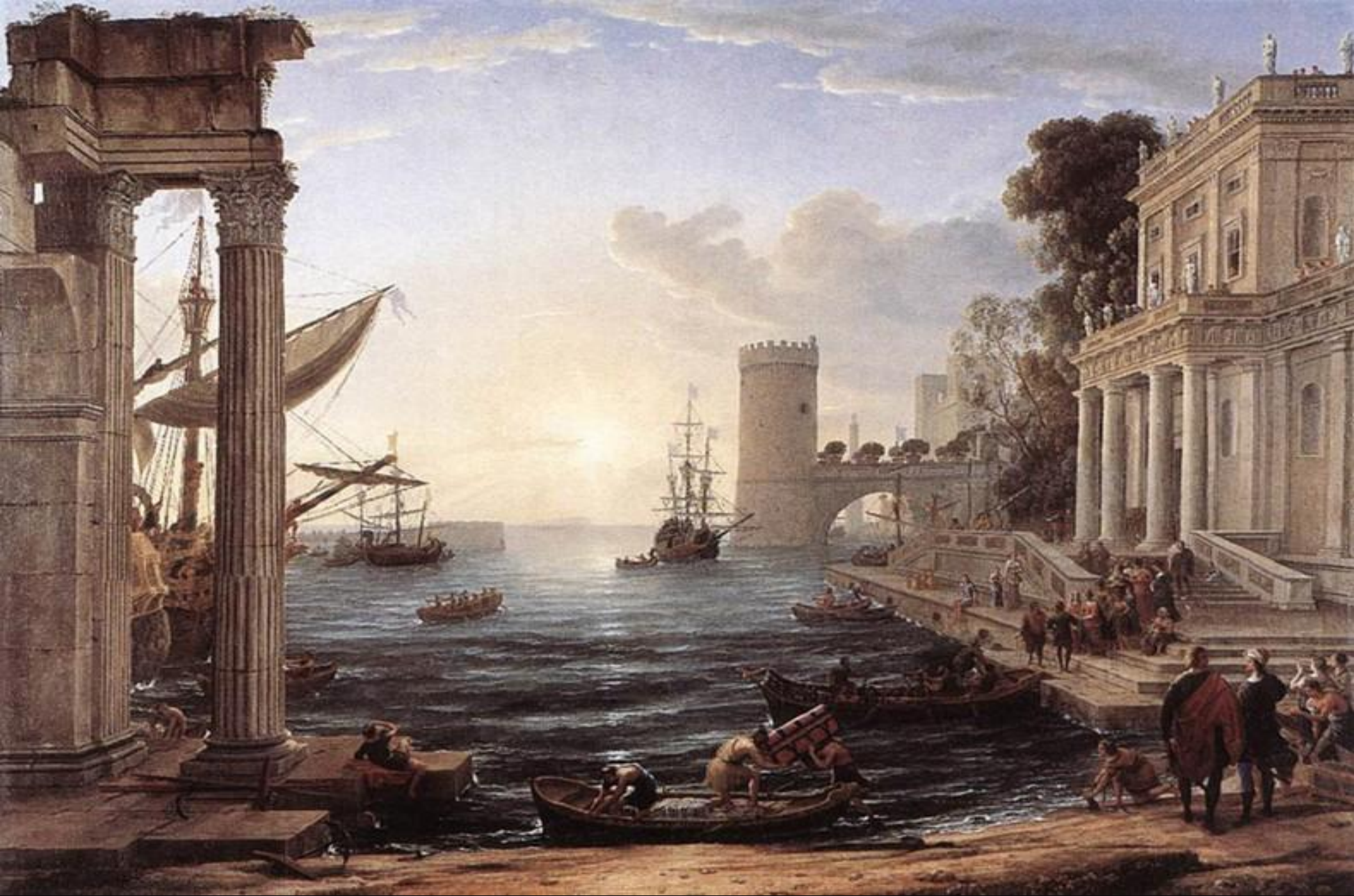
• Отплытие царицы Савской. 1648г.