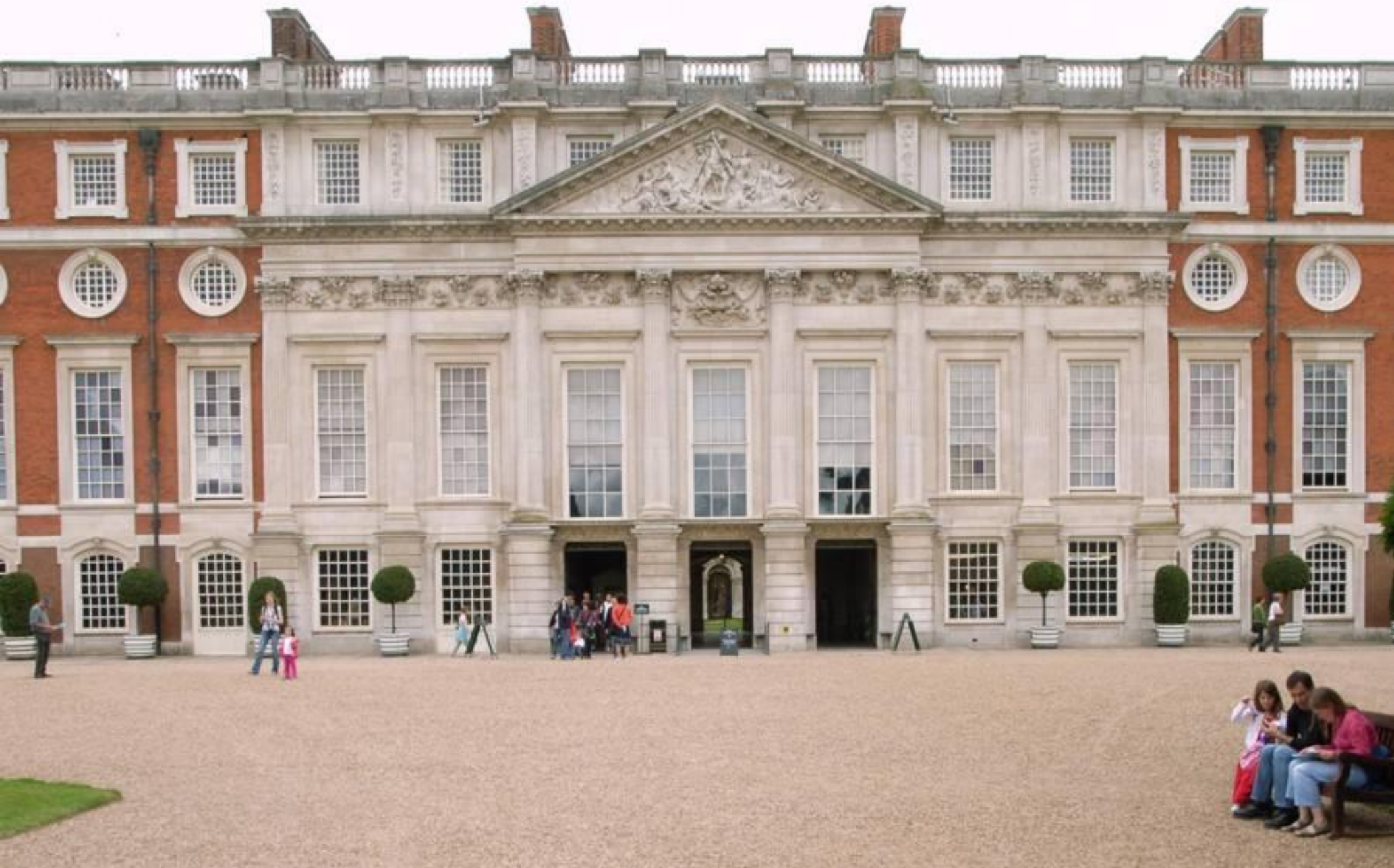
• Хэмптон-корт в Лондоне. 1694г.