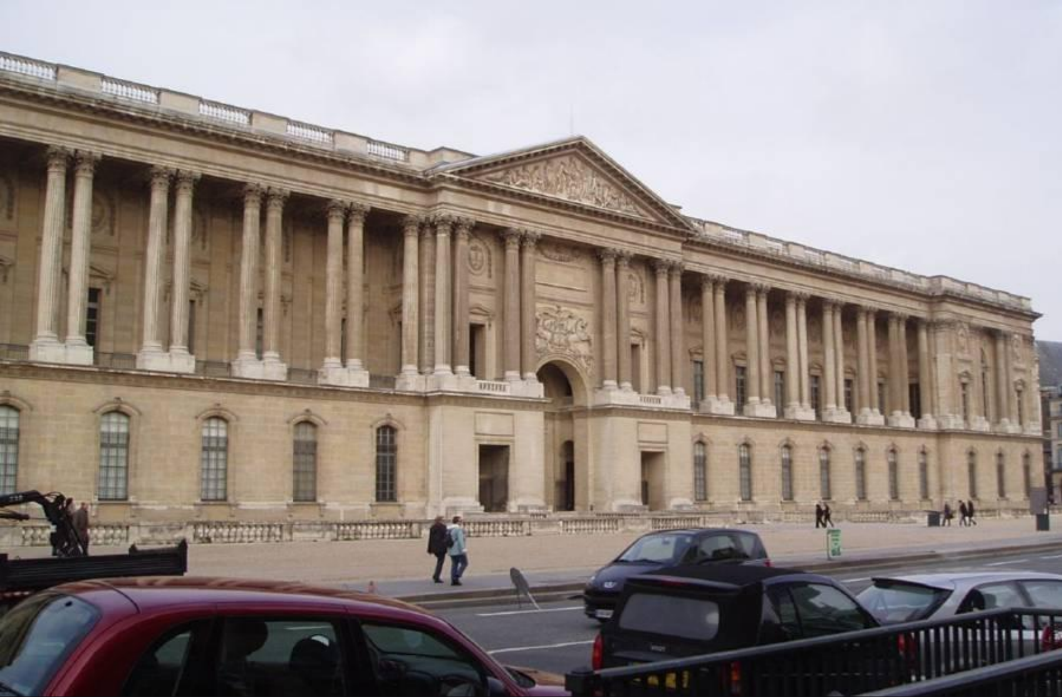
• К. Перро. Восточный фасад Лувра. 1667-1673гг.