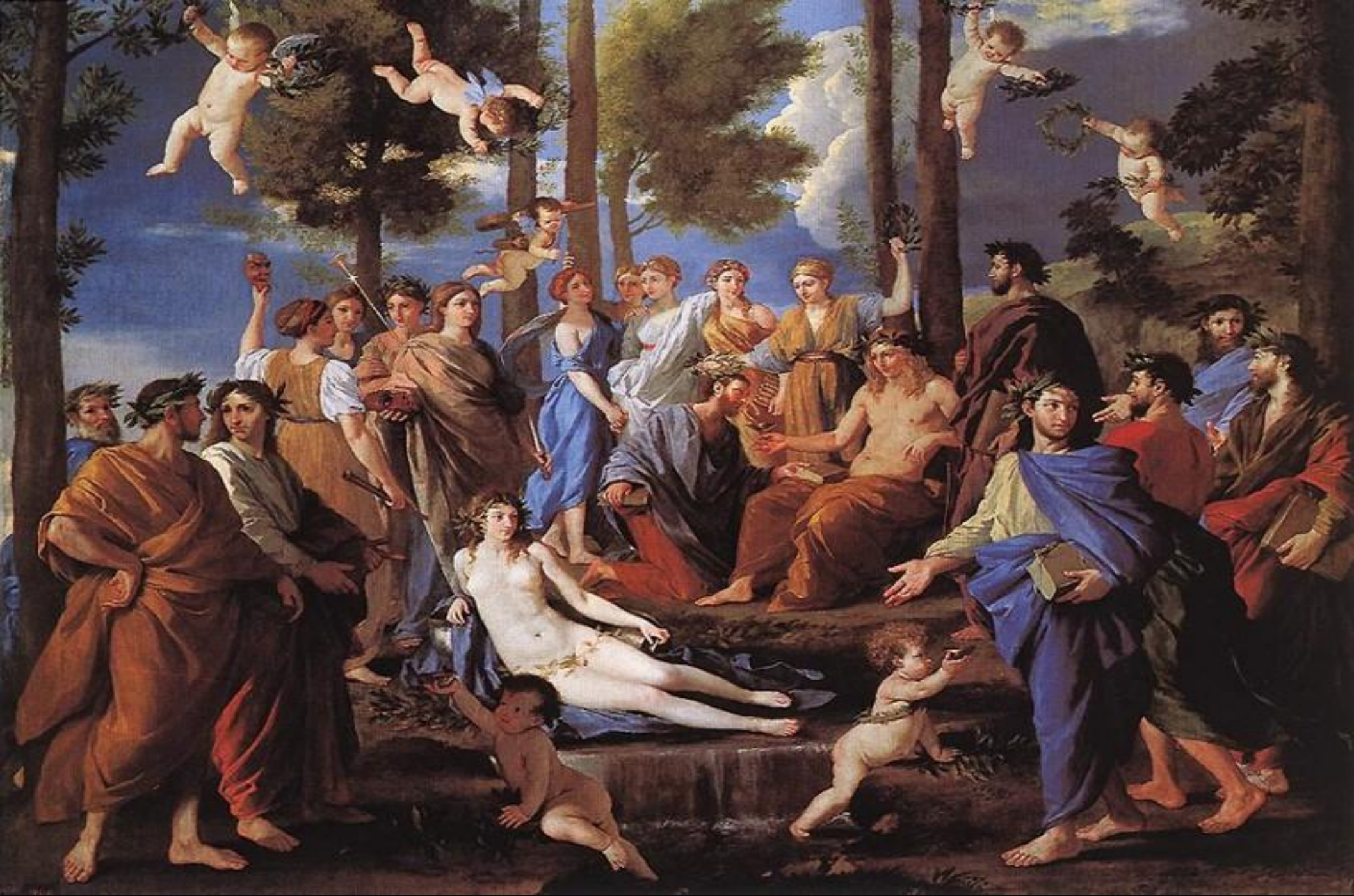
• Парнас. 1635г.