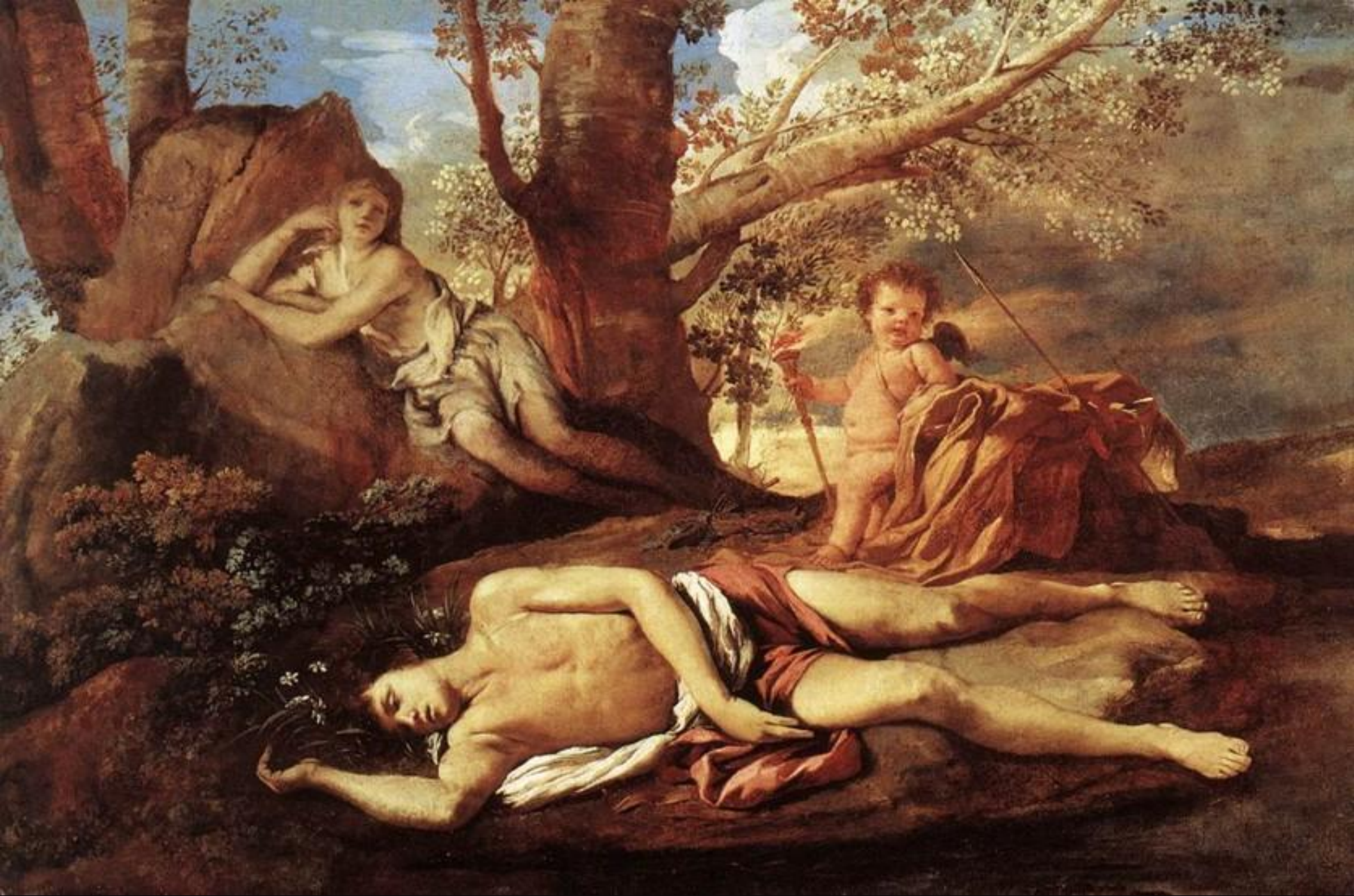
• Нарцисс и Эхо. 1627г.