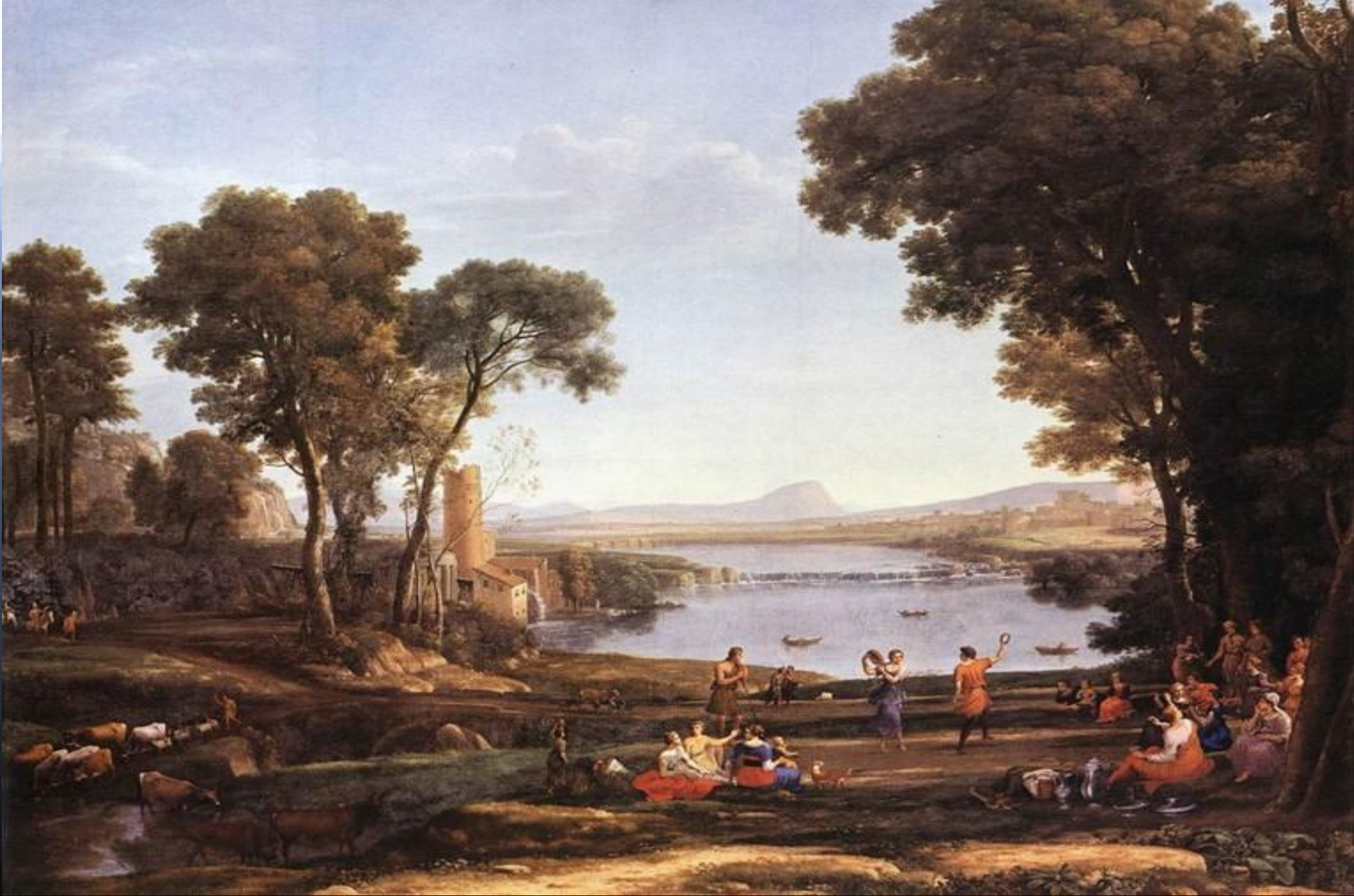
• Бракосочетание Исаака и Ревекки. 1648г.