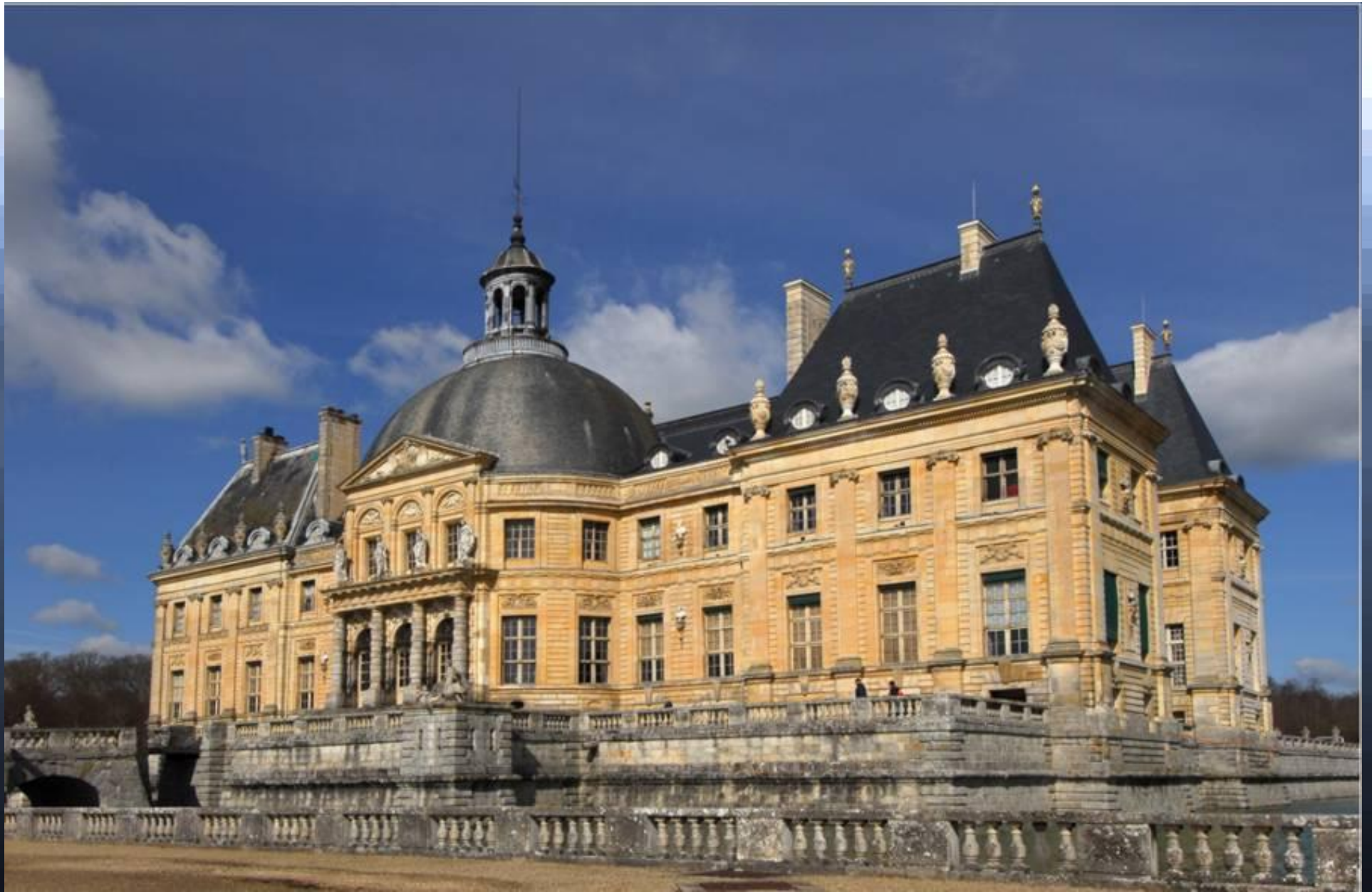
Л.Лево. Дворец Во-ле Виконт. 1661г.