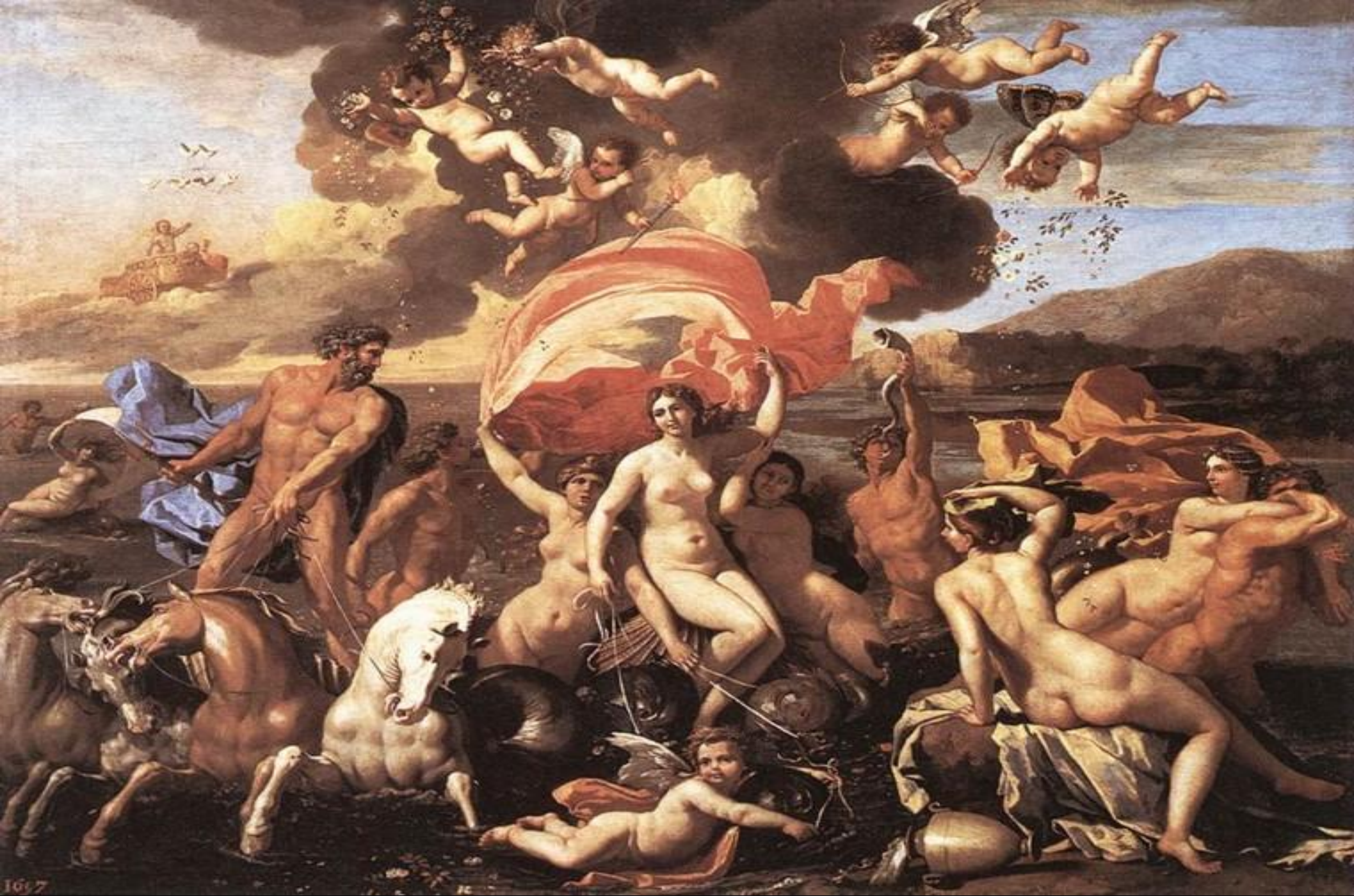
• Триумф Нептуна. 1634г.