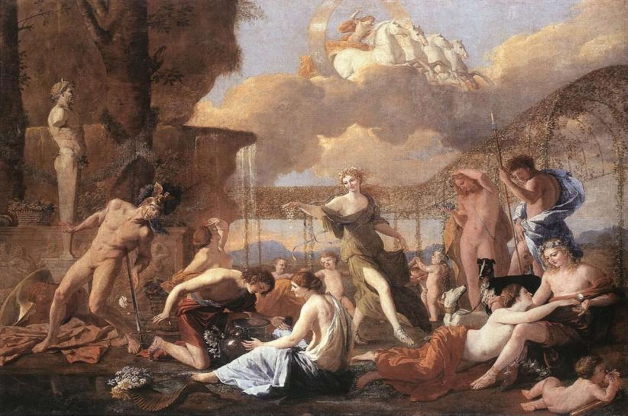
• Царство Флоры. 1632г.