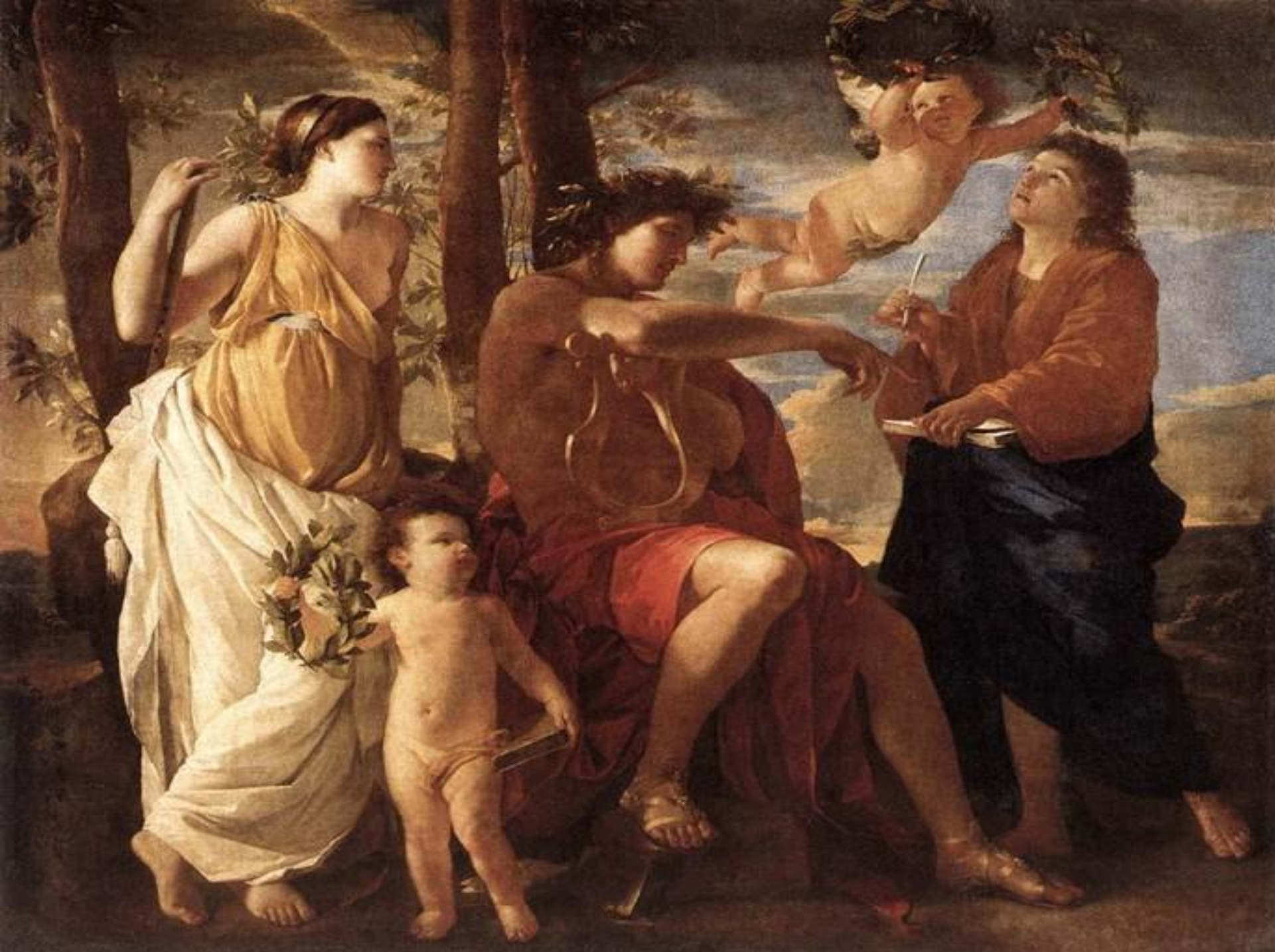
• Вдохновение поэта. 1638г.