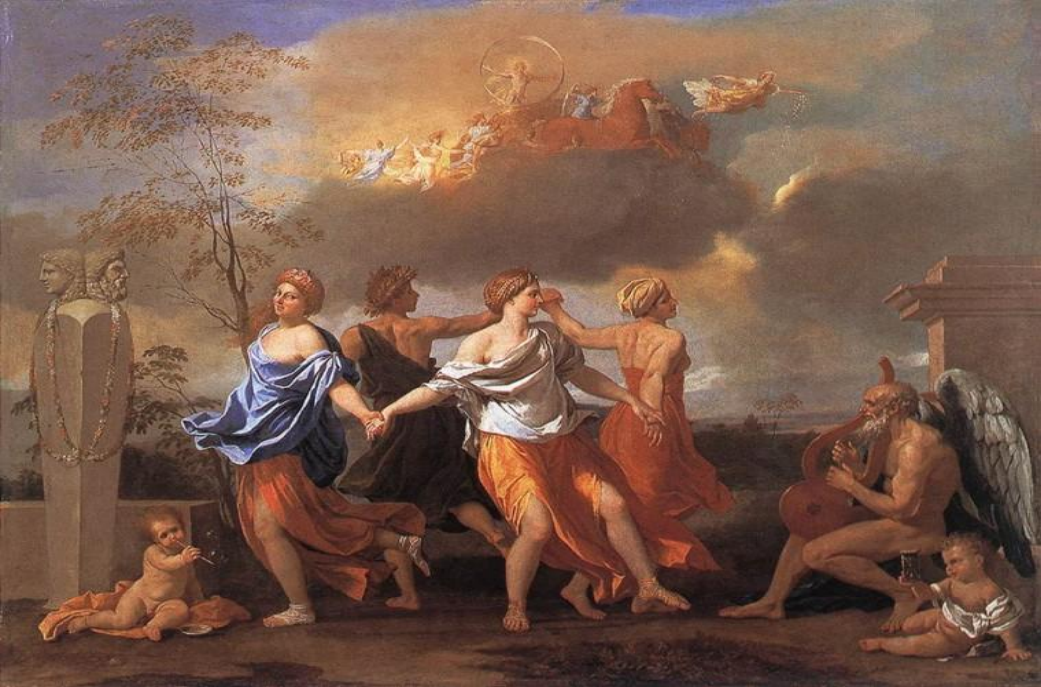
• Танец под музыку времени. 1638г.