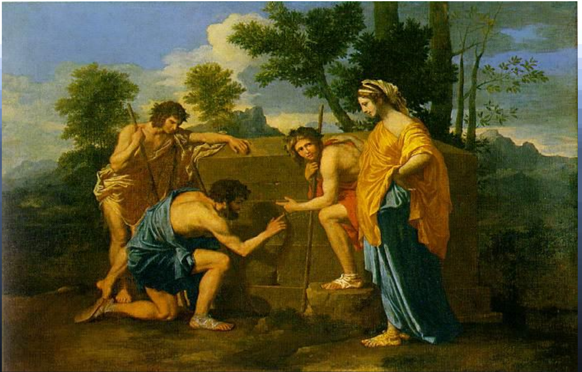
• Аркадские пастухи. 1650г.