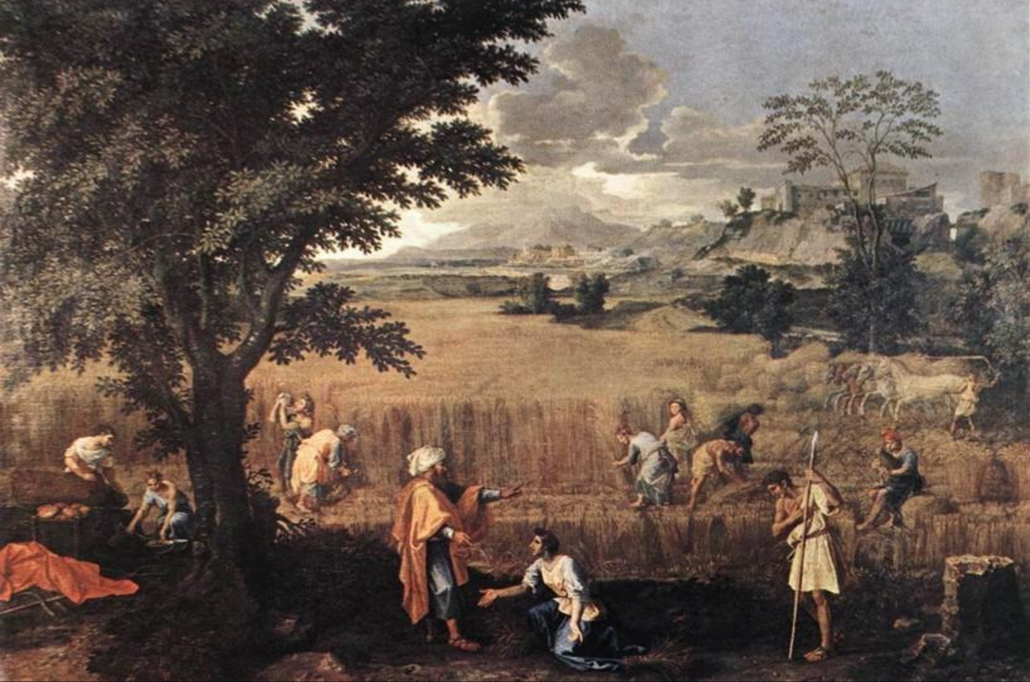
• Лето-Руфь. 1664г.