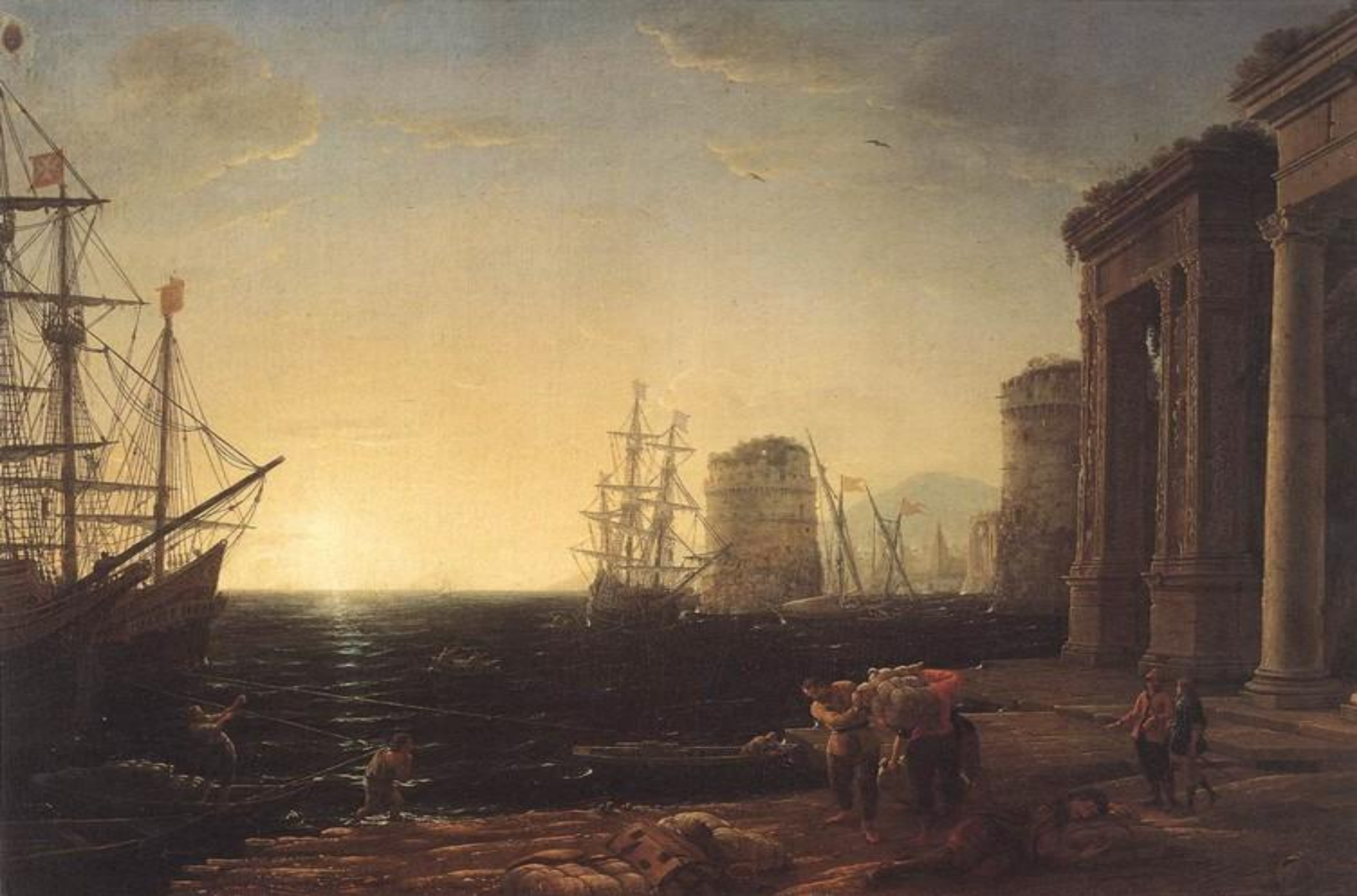
• Гавань при заходе солнца. 1643г.