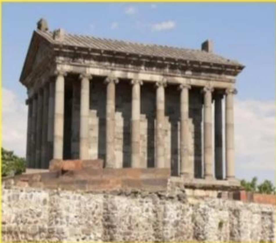
Храм бога Солнца в Гарни

Архитектура Армении имеет давние традиции. Крепость Гарни начали строить еще во II веке до нашей эры и продолжали застраивать в течение античной эпохи и в средние века. Главное место там занимал храм бога Солнца Митры (I век н.э.). Непрístupная цитадель защищала своих жителей от иноземных нашествий 1000 лет.