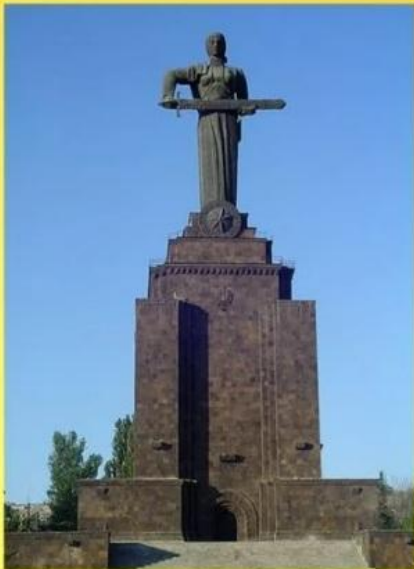
Мать - Армения

Мать -Армения — монумент в Ереване в честь победы Советского Союза в Великой Отечественной войне в Ереване. Высота 54 метра, выполнен из бронзы и гранита. Монумент, созданный скульптором Ара Арутюняном и архитектором Рафаелом Исраеляном, представляет собой образ матери, вкладывающей меч в ножны.