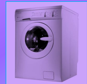
көр юу машинасы