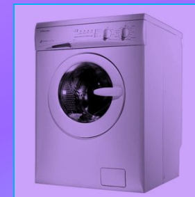
көр юу машинасы