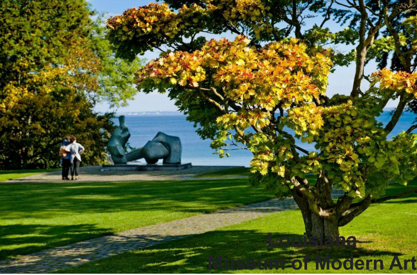
Louisiana Museum of Modern Art