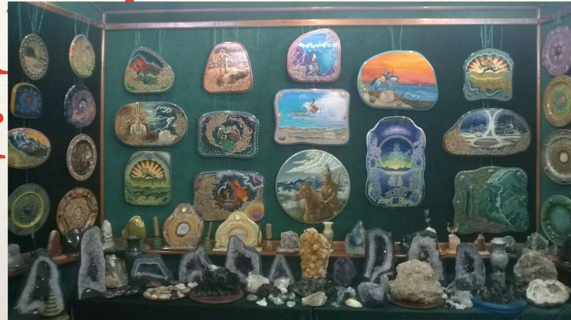
Горный Алтай, село Верх-Уймон, творческое объединение "САМОЦВЕТЫ"