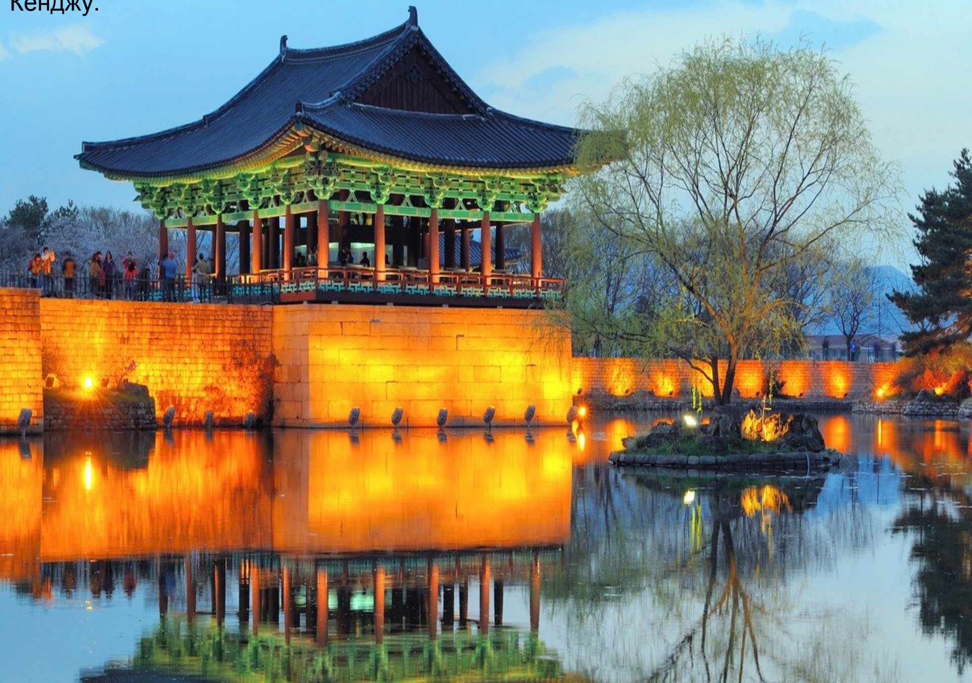
Дворец Тонгун и пруд Вольчи в Кёнджу.