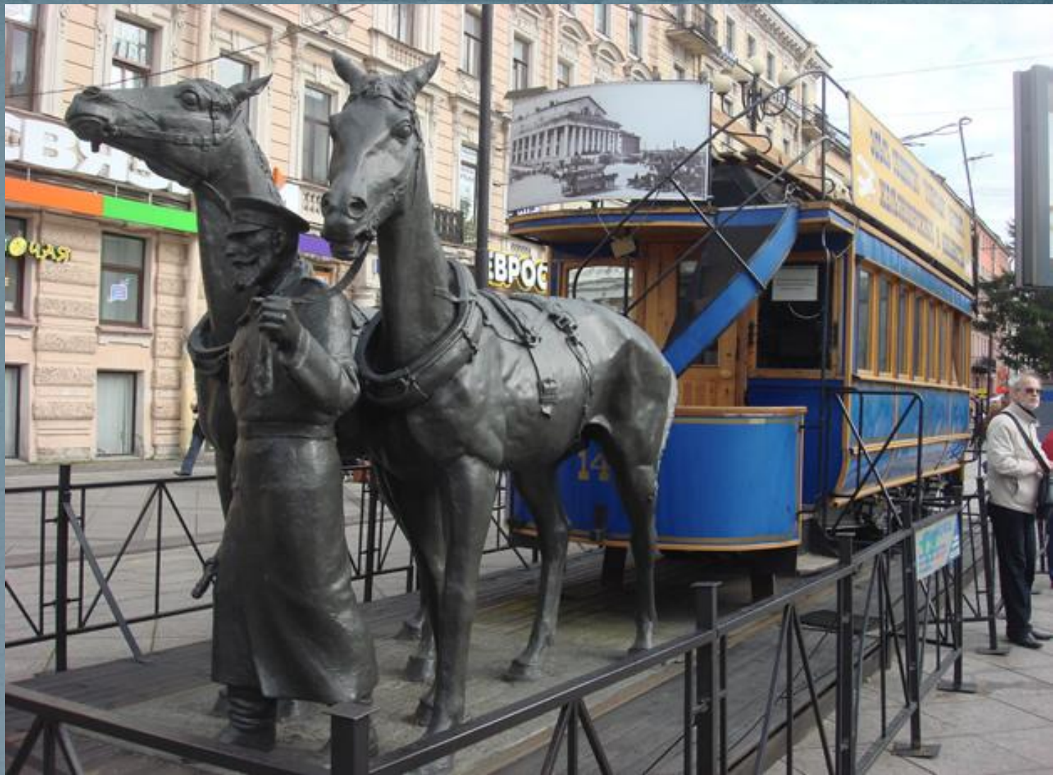
Памятник первой конке в Петербурге.