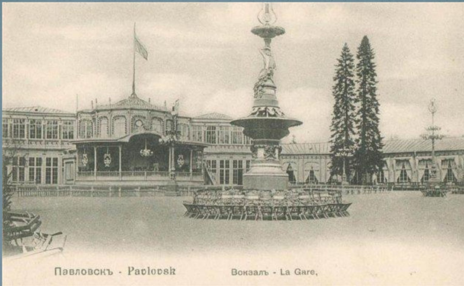
Павловскъ - Pavlovsk