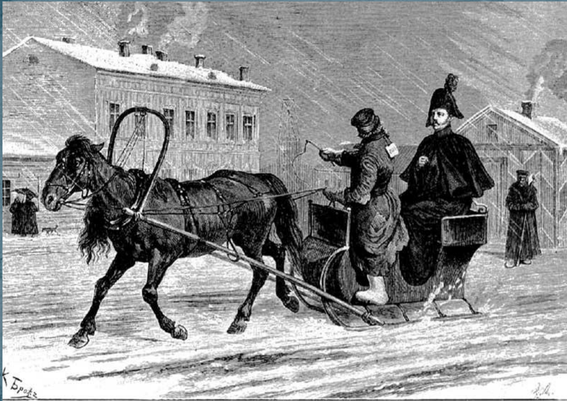
Император Николай I на извозчике.

Извозчики ожидали седоков у вокзалов, гостиниц, на перекрестках и пр., "лихачи" - у здания Городской думы, на углу Троицкой ул. и Невского проспекта и др. С конца XVIII в. до конца XIX в. популярны были "вейки" (или "чухны") - зимние сани для праздничного катания; этот промысел держали приезжие карелы и финны (отсюда название).