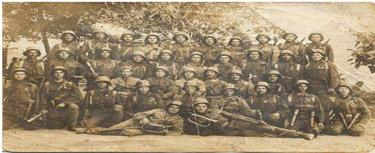
Штурмова бригада УСС

Австрійське командування не поспішало кидати «усусів» до бою, не маючи впевненості щодо їхньої лояльності. Уперше бійці УСС взяли участь в оборонних боях із кубанськими козаками російської армії на Борецькому й Ужоцькому перевалах . Після цих битв відбулося доукомплектування УСС українськими селянами із закарпатських сіл. Австрійське командування завжди скеровувало «усусів» на найважчі завдання. У 1915—1917 рр. «усуси» виявили героїзм у битвах із частинами російської армії на горі Маківка в Карпатах, під Галичем, Бережанами і під час Брусиловського прориву , поблизу містечка Козова, а також біля гори Гаїмаки , де четвертий курінь відбив атаку 5-того кіного ескадрону.