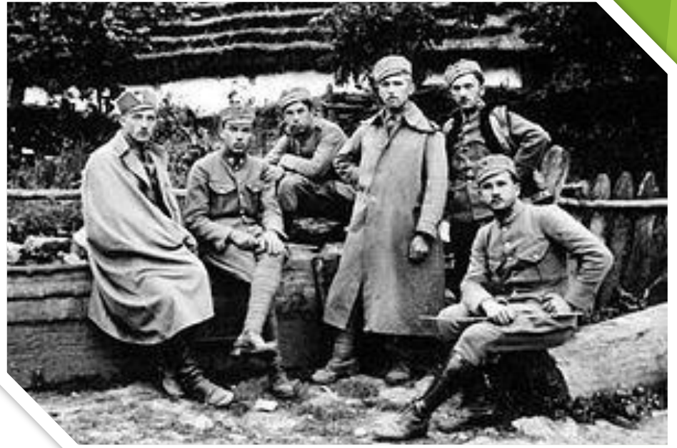
Гурток Пресової Кватири у полку УСС, липень 1916 р