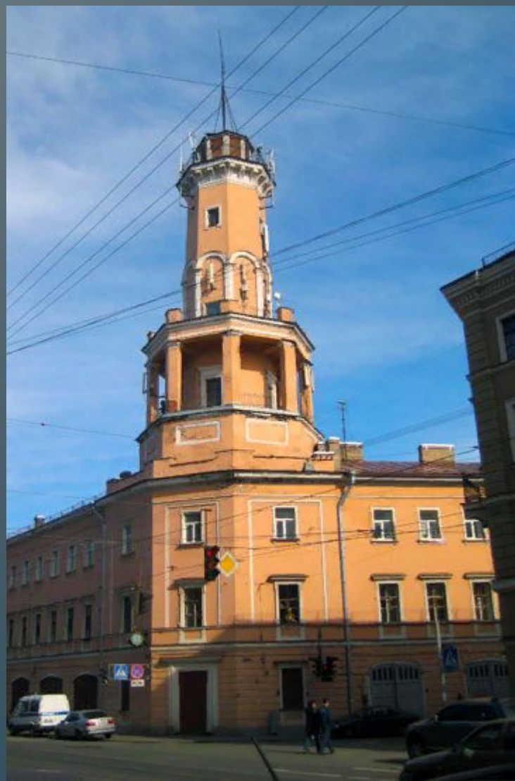
Пожарная каланча в Спасской части Санкт-Петербурга (Садовая улица, 58).

24 июня 1803 года император Александр I подписал указ, по которому жители столицы освобождались от несения пожарной повинности. Из солдат внутренней стражи (полиции) была сформирована первая в России «правильно организованная» пожарная команда из 11 частей общей численностью 1602 человека. 24 июня стал считаться днем рождения пожарного войска, который ежегодно отмечали смотром и парадом. Столетний юбилей петербургской пожарной охраны широко праздновался в 1903 году.