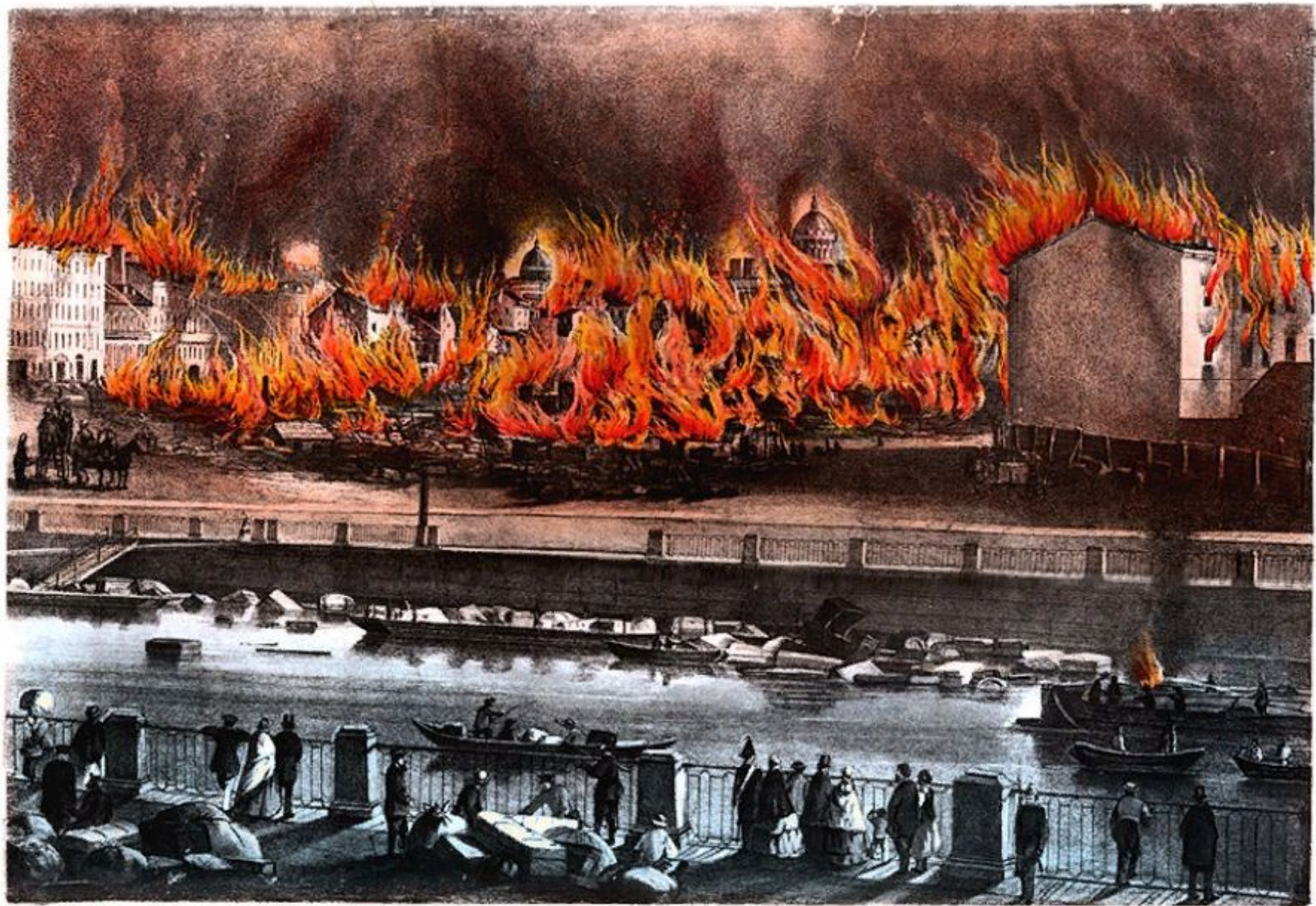
ПОЖАРЪ 28 И 29 МАЯ 1862 ГОДА ВЪ С. ПЕТЕРБУРГѢ