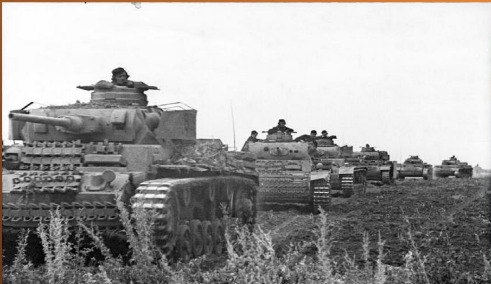
1943 Juni - Juli