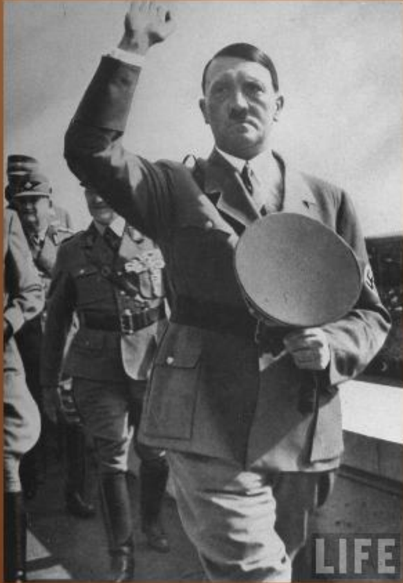
Германия ( Адольф Гитлер)