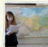
Самароведение. Сочинение. Защита проектов