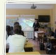
Районный конкурс "К вершинам педагогического успеха - 2015"