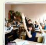
Экоурок "Вода России"